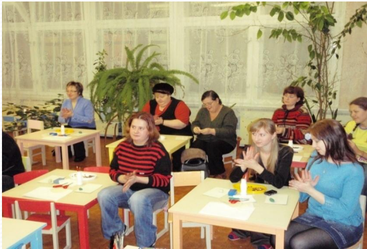
«Учимся лепить животных»