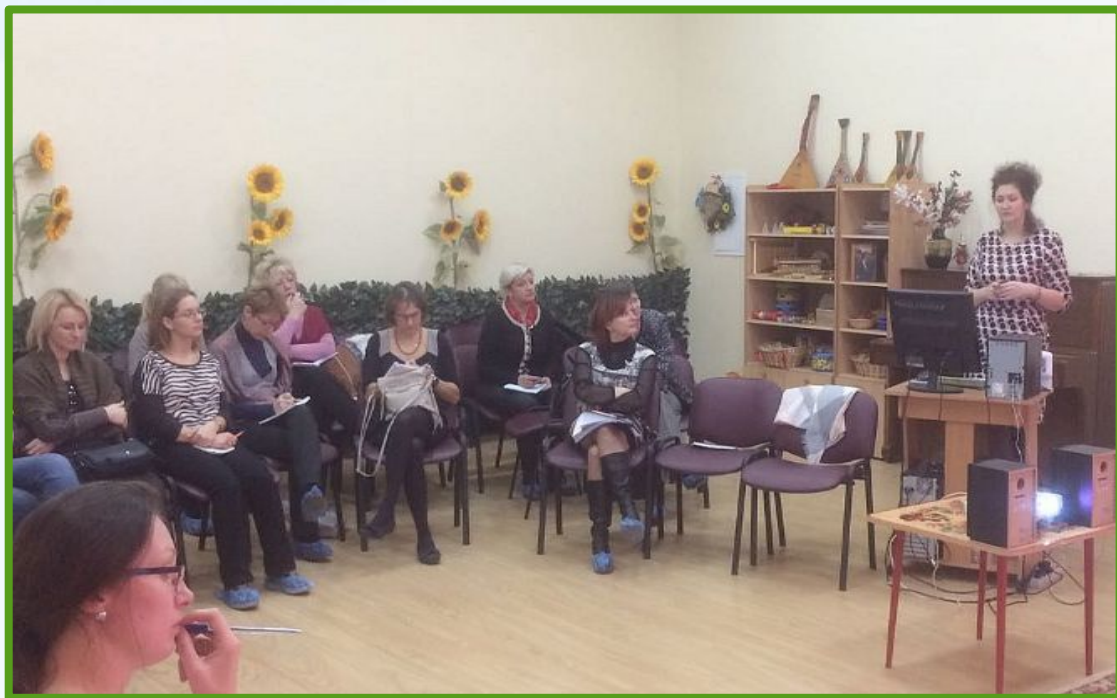
Мастер класс для коллег и родителей