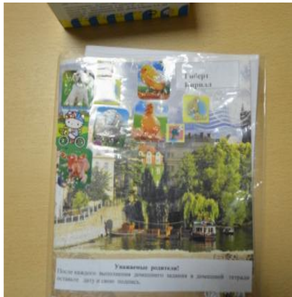
Организация домашних занятий по заданию логопеда