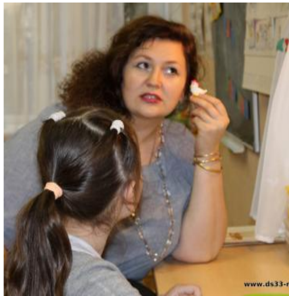
Индивидуальные – занятия консультации совместно с родителями