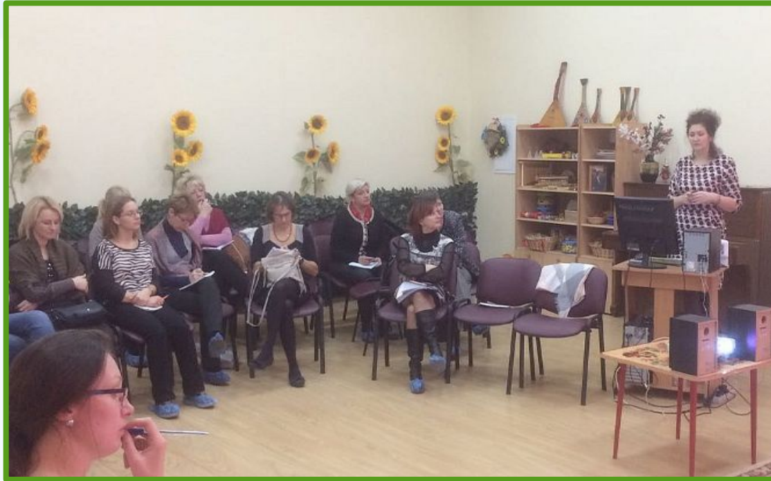
Мастер класс для коллег и родителей