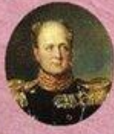
Александр ( I ) Павлович (Благославенный) (1801 - 1825)