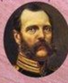
Александр ( II ) Николаевич (Освободитель) (1855 - 1881)