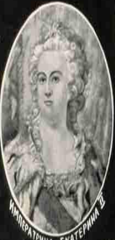
ИМПЕРАТРИЦА ЕКАТЕРИНА II 1762 - 1796