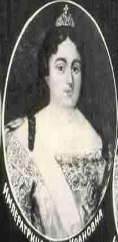
ИМПЕРАТРИЦА АННА ИВАНОВНА 1730 - 1740