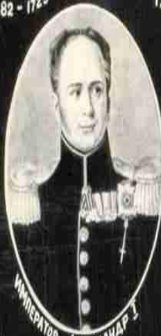
ИМПЕРАТОР АЛЕКСАНДР I 1801 - 1825