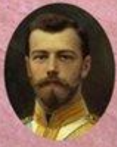
Николай ( II ) Александрович (1894 - 1917)