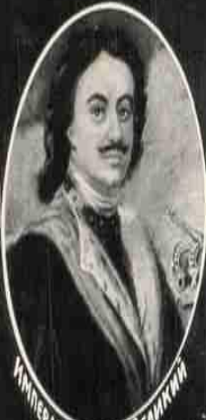
ИМПЕРАТОР ПЕТР ВЕЛИКИЙ 1682 - 1725