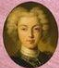
Пётр (II) Алексеевич (1727 - 1730)