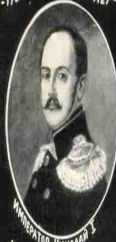
ИМПЕРАТОР НИКОЛАЙ I 1825 - 1855