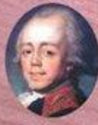
Павел ( I ) Петрович (1796-1801)