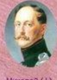
Николай ( I ) Павлович (1825 - 1855)