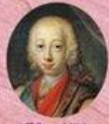
Пётр ( III ) Фёдорович (Карл-Пётр-Ульрих) (1761-1762)