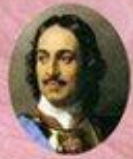
Пётр I (Великий) Алексеевич (1682 - 1725)