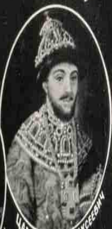
ЦАРЬ ФЕДОР АЛЕКСЕЕВИЧ 1676 - 1682