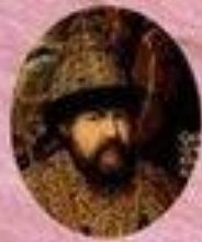
Алексей Михайлович (1645 - 1676) (Тишайший)