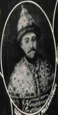
ЦАРЬ АЛЕКСЕЙ МИХАЙЛОВИЧ 1645 - 1676