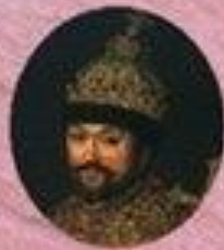
Михаил Фёдорович (1613 -1645)