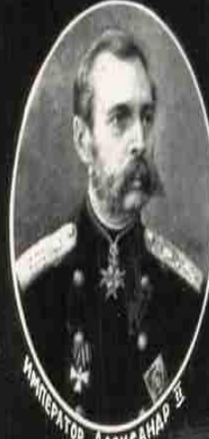
ИМПЕРАТОР АЛЕКСАНДР II 1855 - 1881