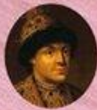
Фёдор(III) Алексеевич (1676-1682)