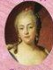
Елизавета Петровна (1741 - 1761)