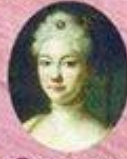
Анна Леопольдовна (Правительница регентша) (Елизавета Катерина Кристина Мекленбург-Шверинская) (1740 - 1741)