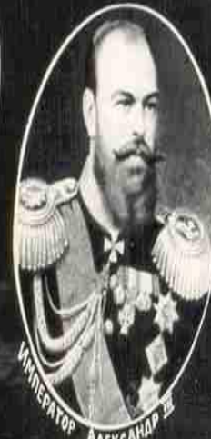
ИМПЕРАТОР АЛЕКСАНДР III 1881 - 1894