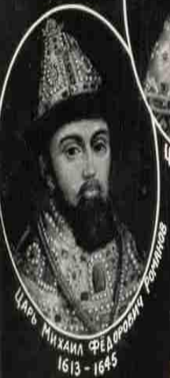
ЦАРЬ МИХАИЛ ФЕДОРОВИЧ ГОРДИНОВ 1613 - 1645