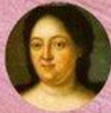
Анна Иоанновна (1730 1740)