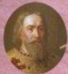
Фёдор Никитович ( Патриарх Филарет) (1619 -1633)