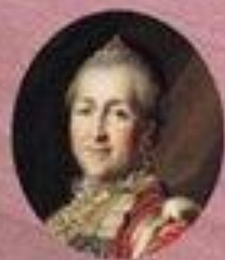
Екатерина ( II ) Алексеевна (София-Фредерика- -Августа Ангальт- -Цербстская) (1762-1796)