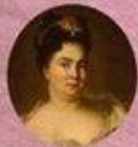
Екатерина I Алексеевна (Марта Скаеронская) (1725 -1727)