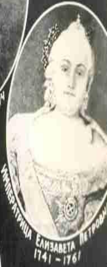
ИМПЕРАТРИЦА ЕЛИЗАВЕТА ПЕТРОВНА 1741 - 1761