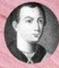
Иван(V) Алексеевич (1682 -1696) (правил совместно с Петром I)