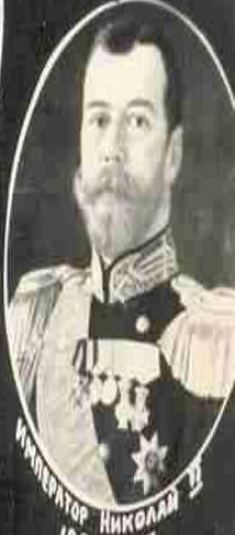
ИМПЕРАТОР НИКОЛАЙ II 1894 - 1917