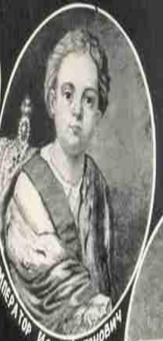
ИМПЕРАТОР ИВАН АНТОНОВИЧ 1740 - 1741