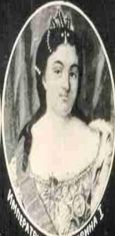
ИМПЕРАТРИЦА ЕКАТЕРИНА I 1725 - 1727