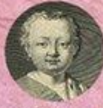
Иван V (Иоанн III) Антонович (1740 - 1741)