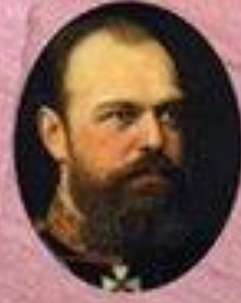
Александр ( III ) Александрович (Миротворец) (1881 - 1894)