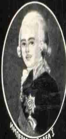
ИМПЕРАТОР ПАВЕЛ I 1796 - 1801