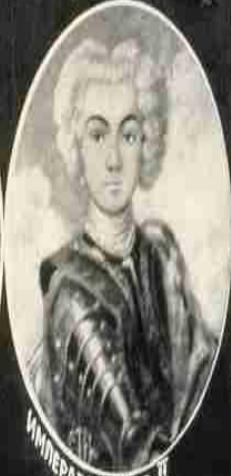
ИМПЕРАТОР ПЕТР II 1727 - 1730