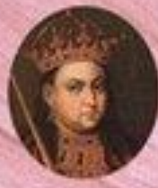
Софья Алексеевна (Правительница) регентша (1682 - 1689)