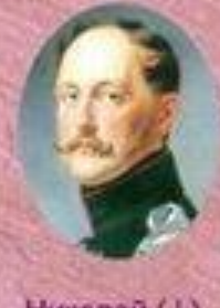
Николай ( I ) Павлович (1825 - 1855)