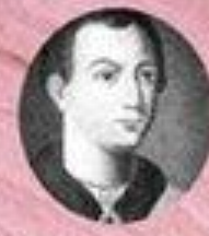
Иван(V) Алексеевич (1682 -1696) (правил совместно с Петром I)