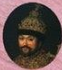
Михаил Фёдорович (1613 -1645)