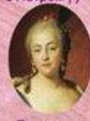
Елизавета Петровна (1741 - 1761)