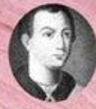
Иван(V) Алексеевич (1682 -1696) (правил совместно с Петром I)