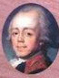
Павел ( I ) Петрович (1796-1801)