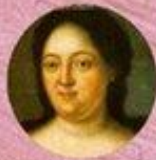
Анна Иоанновна (1730 1740)