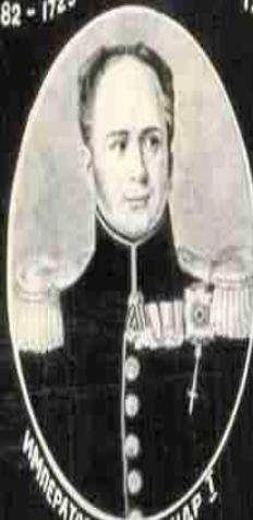
ИМПЕРАТОР АЛЕКСАНДР I 1801 - 1825