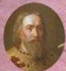
Фёдор Никитович ( Патриарх Филарет) (1619 -1633)