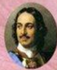
Пётр I (Великий) Алексеевич (1682 - 1725)