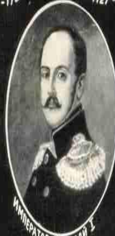
ИМПЕРАТОР НИКОЛАЙ I 1825 - 1855