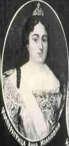
ИМПЕРАТРИЦА АННА ИВАНОВНА 1730 - 1740