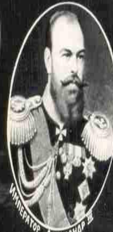
ИМПЕРАТОР АЛЕКСАНДР III 1881 - 1894