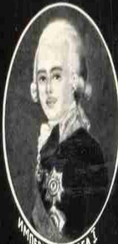
ИМПЕРАТОР ПАВЕЛ I 1796 - 1801