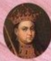
Софья Алексеевна (Правительница) регентша (1682 - 1689)