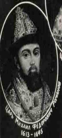
ЦАРЬ МИХАИЛ ФЕДОРОВИЧ ГОРЧАКОВ 1613 - 1645