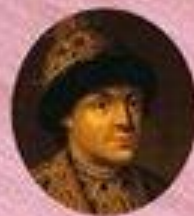
Фёдор(III) Алексеевич (1676-1682)