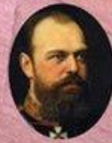
Александр ( III ) Александрович (Миротворец) (1881 - 1894)