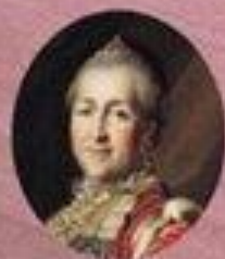
Екатерина ( II ) Алексеевна (София-Фредерика- Августа Ангальт- Цербстская) (1762-1796)