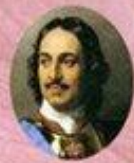
Пётр I (Великий) Алексеевич (1682 - 1725)