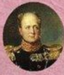
Александр ( I ) Павлович (Благославенный) (1801 - 1825)