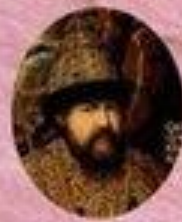
Алексей Михайлович (1645 - 1676) (Тишайший)