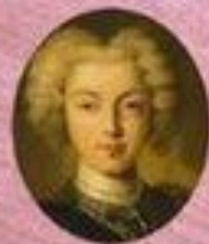
Пётр (II) Алексеевич (1727 - 1730)