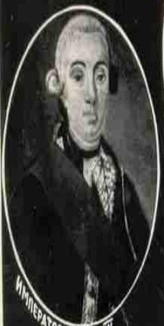
ИМПЕРАТОР ПЕТР III 1762 - 1762