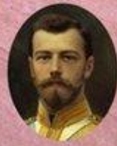
Николай ( II ) Александрович (1894 - 1917)