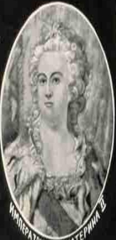
ИМПЕРАТРИЦА ЕКАТЕРИНА II 1762 - 1796