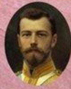
Николай ( II ) Александрович (1894 - 1917)