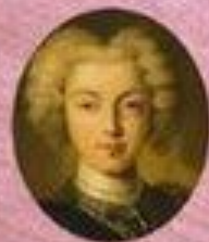
Пётр (II) Алексеевич (1727 - 1730)