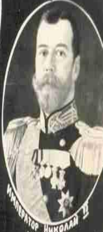
ИМПЕРАТОР НИКОЛАЙ II 1894 - 1917