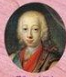
Пётр ( III ) Фёдорович (Карл-Пётр-Ульрих) (1761-1762)