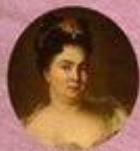
Екатерина I Алексеевна (Марта Скаеронская) (1725 -1727)