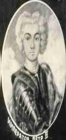
ИМПЕРАТОР ПЕТР II 1727 - 1730