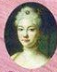
Анна Леопольдовна (Правительница регентша) Петровна (Елизавета Катерина Кристина Мекленбург-Шверинская) (1740 - 1741)