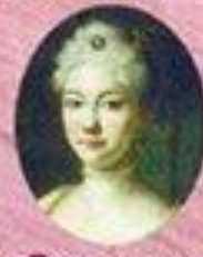
Анна Леопольдовна (Правительница регентша) Петровна (Елизавета Катерина Кристина Мекленбург-Шверинская) (1740 - 1741)