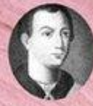
Иван(V) Алексеевич (1682 -1696) (правил совместно с Петром I)