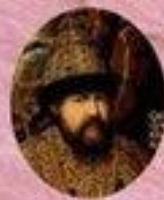
Алексей Михайлович (1645 - 1676) (Тишайший)