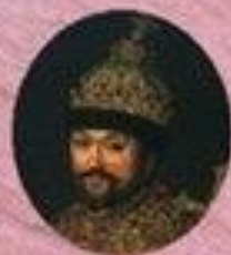
Михаил Фёдорович (1613 -1645)