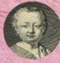
Иван V (Иоанн III) Антонович (1740 - 1741)