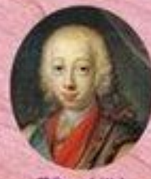
Пётр ( III ) Фёдорович (Карл-Пётр-Ульрих) (1761-1762)