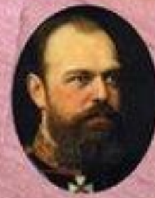
Александр ( III ) Александрович (Миротворец) (1881 - 1894)