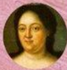
Анна Иоанновна (1730 1740)