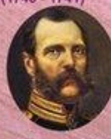
Александр ( II ) Николаевич (Освободитель) (1855 - 1881)