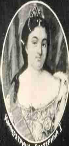
ИМПЕРАТРИЦА ЕКАТЕРИНА I 1725 - 1727