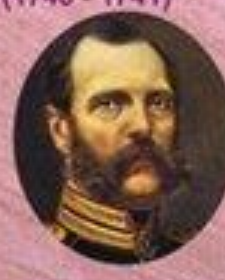
Александр ( II ) Николаевич (Освободитель) (1855 - 1881)