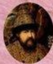
Алексей Михайлович (1645 - 1676) (Тишайший)