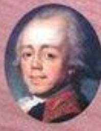
Павел ( I ) Петрович (1796-1801)