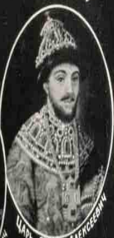
ЦАРЬ ФЕДОР АЛЕКСЕЕВИЧ 1676 - 1682