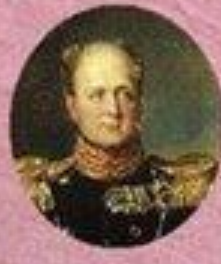
Александр ( I ) Павлович (Благославенный) (1801 - 1825)