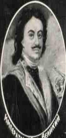
ИМПЕРАТОР ПЕТР ВЕЛИКИЙ 1682 - 1725