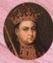
Софья Алексеевна (Правительница) регентша (1682 - 1689)