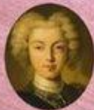
Пётр (II) Алексеевич (1727 - 1730)