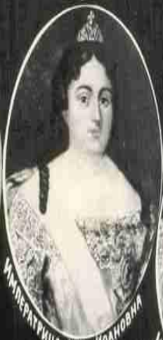
ИМПЕРАТРИЦА АННА ИВАНОВНА 1730 - 1740