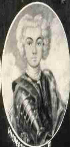
ИМПЕРАТОР ПЕТР II 1727 - 1730