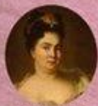
Екатерина I Алексеевна (Марта Скаеронская) (1725 -1727)