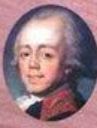
Павел ( I ) Петрович (1796-1801)