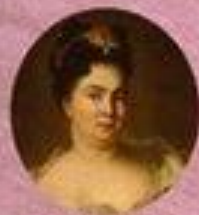
Екатерина I Алексеевна (Марта Скаеронская) (1725 -1727)