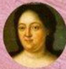
Анна Иоанновна (1730 1740)