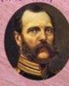
Александр ( II ) Николаевич (Освободитель) (1855 - 1881)