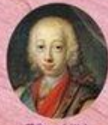
Пётр ( III ) Фёдорович (Карл-Пётр-Ульрих) (1761-1762)