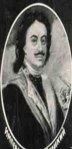
ИМПЕРАТОР ПЕТР ВЕЛИКИЙ 1682 - 1725