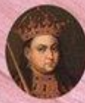
Софья Алексеевна (Правительница) регентша (1682 - 1689)