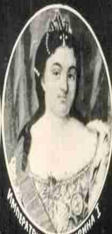
ИМПЕРАТРИЦА ЕКАТЕРИНА I 1725 - 1727