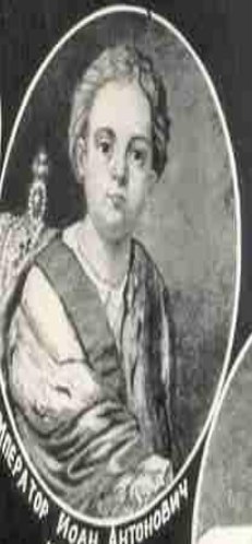
ИМПЕРАТОР ИВАН АНТОНОВИЧ 1740 - 1741