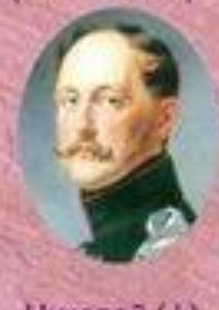
Николай ( I ) Павлович (1825 - 1855)