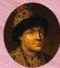
Фёдор(III) Алексеевич (1676-1682)