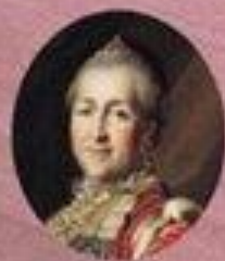
Екатерина ( II ) Алексеевна (София-Фредерика- -Августа Ангальт- -Цербстская) (1762-1796)