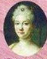
Анна Леопольдовна (Правительница регентша) Петровна (Елизавета Катерина Кристина Мекленбург-Шверинская) (1740 - 1741)