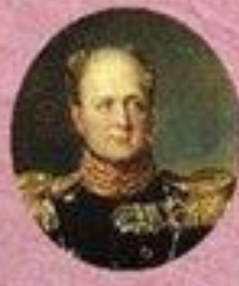
Александр ( I ) Павлович (Благославенный) (1801 - 1825)