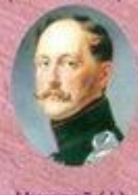
Николай ( I ) Павлович (1825 - 1855)