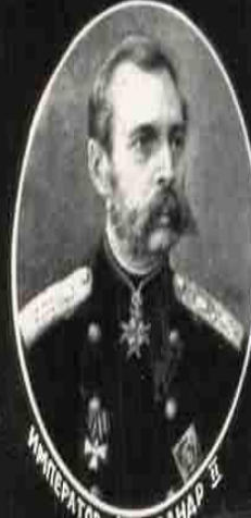
ИМПЕРАТОР АЛЕКСАНДР II 1855 - 1881