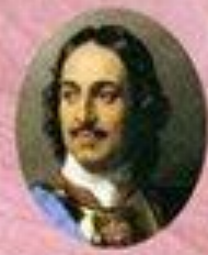
Пётр I (Великий) Алексеевич (1682 - 1725)