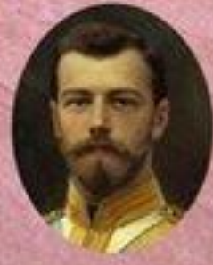
Николай ( II ) Александрович (1894 - 1917)