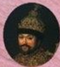
Михаил Фёдорович (1613 -1645)