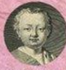
Иван V (Иоанн III) Антонович (1740 - 1741)