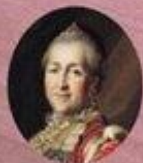
Екатерина ( II ) Алексеевна (София-Фредерика- -Августа Ангальт- -Цербстская) (1762-1796)