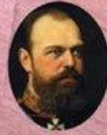
Александр ( III ) Александрович (Миротворец) (1881 - 1894)