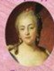
Елизавета Петровна (1741 - 1761)