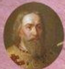
Фёдор Никитович ( Патриарх Филарет) (1619 -1633)