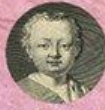
Иван V (Иоанн III) Антонович (1740 - 1741)