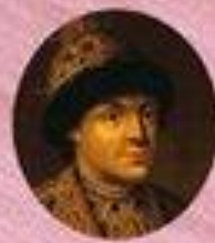
Фёдор(III) Алексеевич (1676-1682)