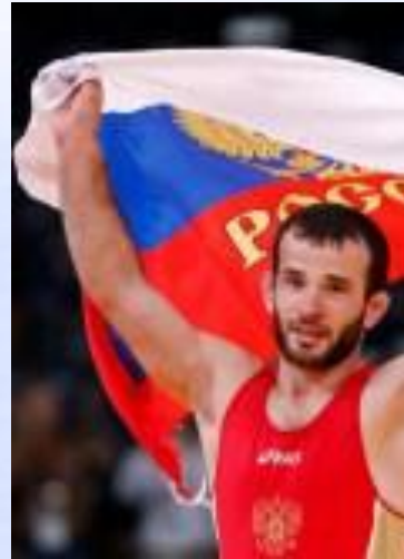
Отарсултанов Джамал Султанович Российский борец вольного стиля, олимпийский чемпион