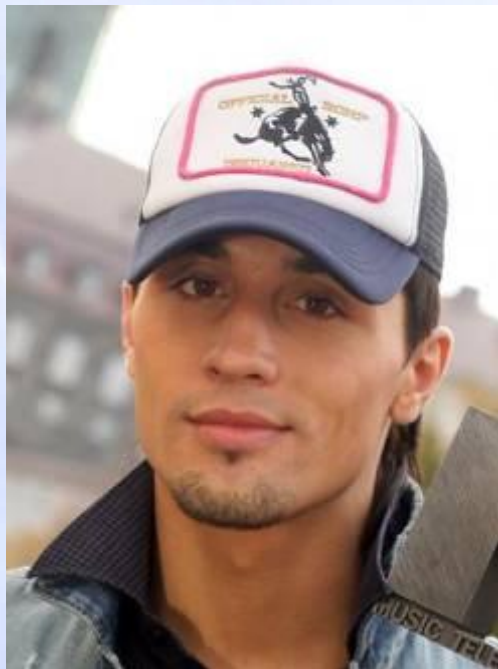
Дима Билан известный российский певец.