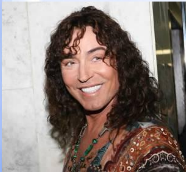
Леонтьев Валерий Яковлевич – народный артист России