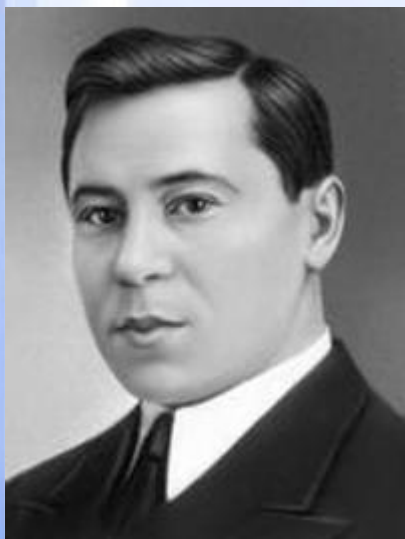
Муса Джалиль знаменитый поэт-патриот