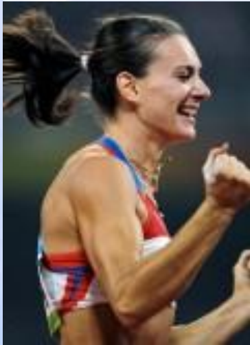
Исинбаева Елена Гаджиевна Спортсменка в прыжках с шестом, двукратная олимпийская чемпионка