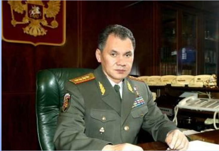
Министр обороны РФ - Шойгу Сергей Кужугетович