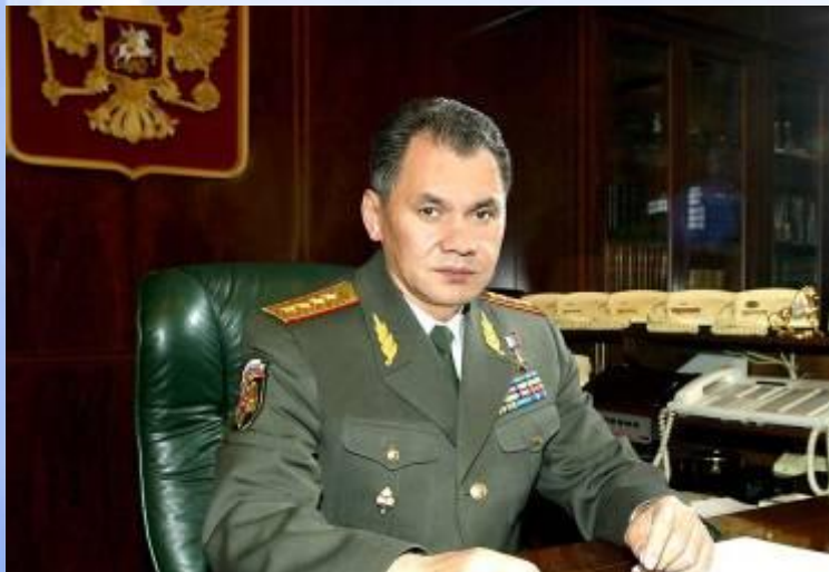
Министр обороны РФ - Шойгу Сергей Кужугетович