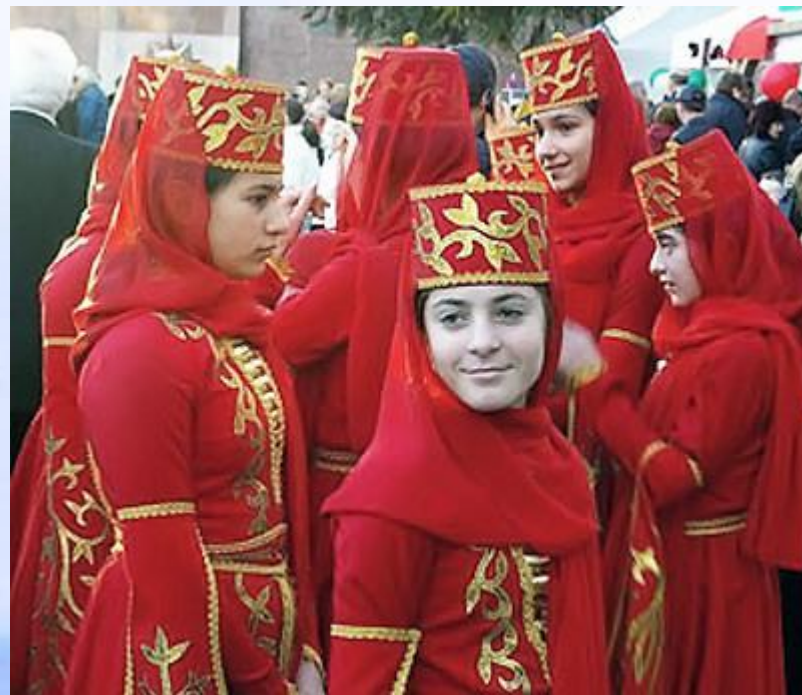
Национальный костюм народов Карачаево-Черкессии