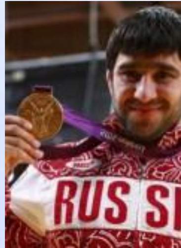
Исаев Мансур Мустафаевич Российский дзюдоист, олимпийский чемпион