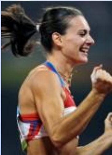
Исинбаева Елена Гаджиевна Спортсменка в прыжках с шестом, двукратная олимпийская чемпионка