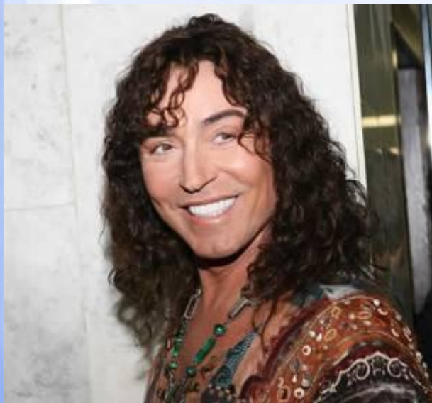
Леонтьев Валерий Яковлевич – народный артист России