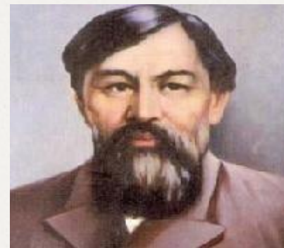
Портрет Ибрая Алтынсарина

Ибрай Алтынсарин - казахский педагог-просветитель, писатель, фольклорист, общественный деятель, ученый-этнограф. Его имя занимает почетное место в ряду имен исторических деятелей, составляющих национальную гордость казахского народа. Всю свою сознательную жизнь выдающийся просветитель-педагог, крупный писатель, талантливый поэт посвятил делу борьбы за его счастье. Вся многогранная творческая и общественная деятельность Ибрая Алтынсарина была подчинена главной задаче - приобщению казахского народа к прогрессивной мировой культуре, укреплению дружбы между народами.