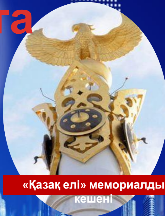
«Қазақ елі» мемориалды кешені