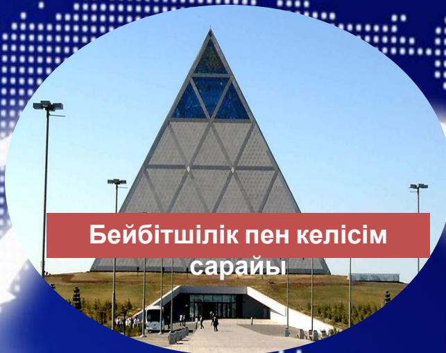
Бейбітшілік пен келісім сарайы