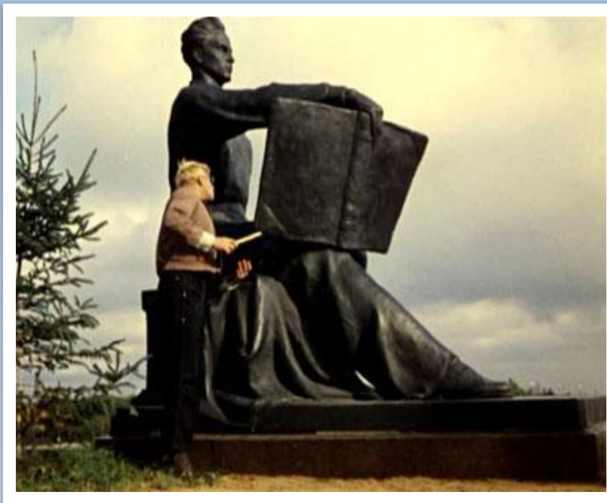
Памятник студенту с книжкой