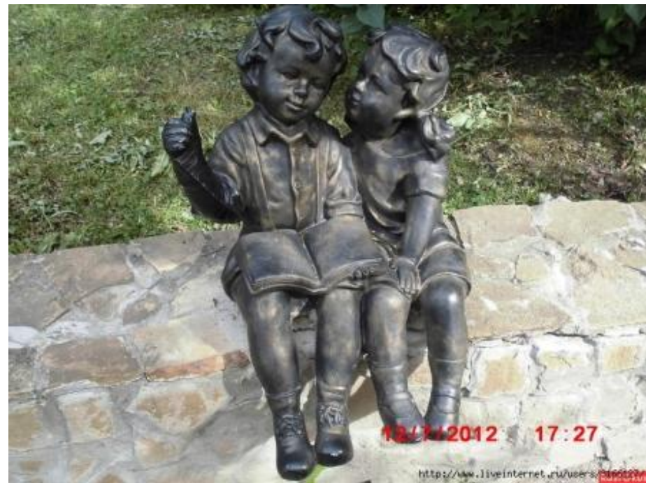
Памятник читателям в Москве