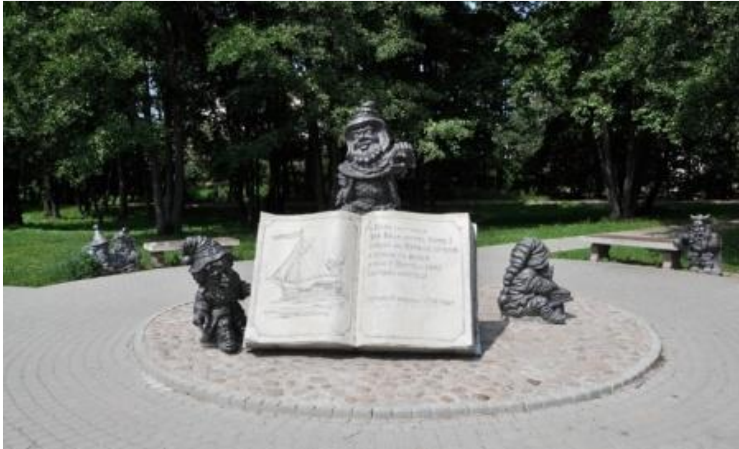
Памятник книге в Сестрорецке "Учёные гномы", Санкт-Петербург