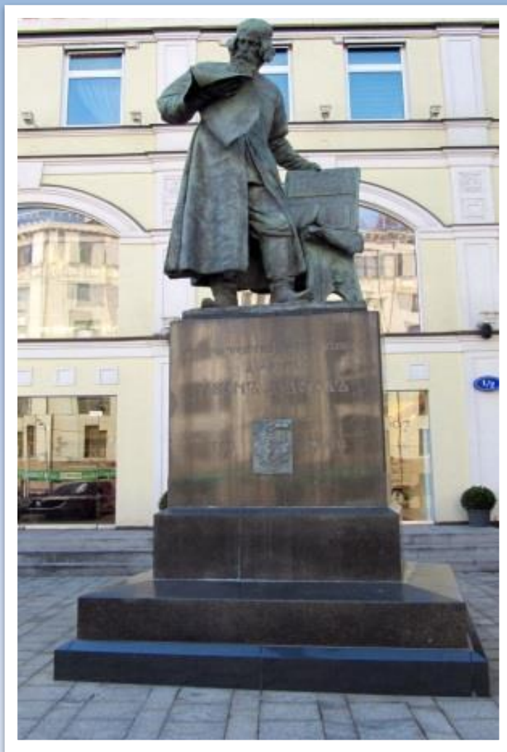
Памятник первому русскому книгопечатнику Ивану Фёдорову. Скульптор С.М. Волнухин.