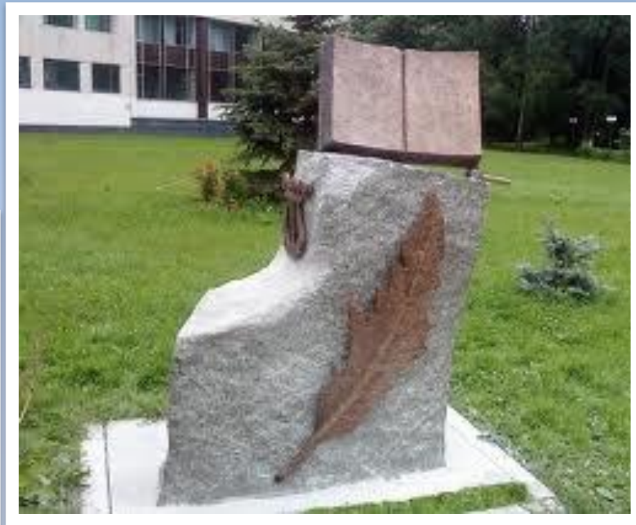
Памятник книге в Химках, Московская обл.