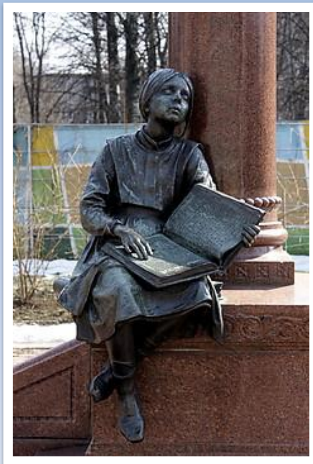
Памятник слепой читающей девочке в Санкт-Петербурге (фрагмент памятника К.Гроту)