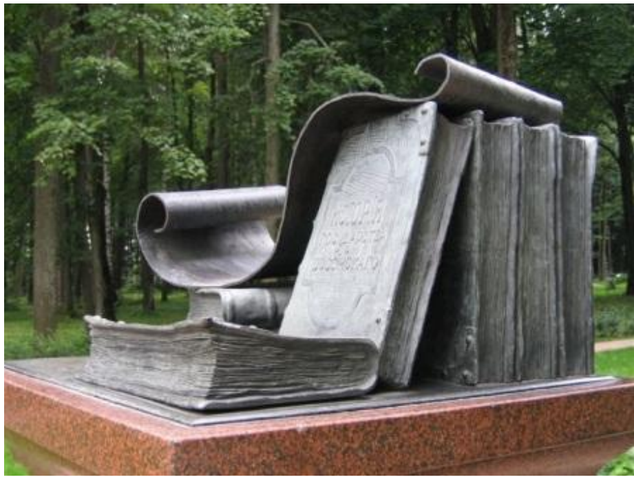
Памятник книге в усадьбе Остафьево, Московская обл.