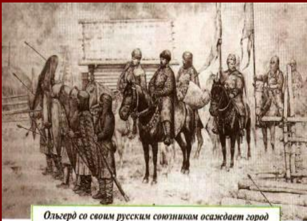
Ольгерд со своим русским союзникам осаждают город Художник Н.И. Белов