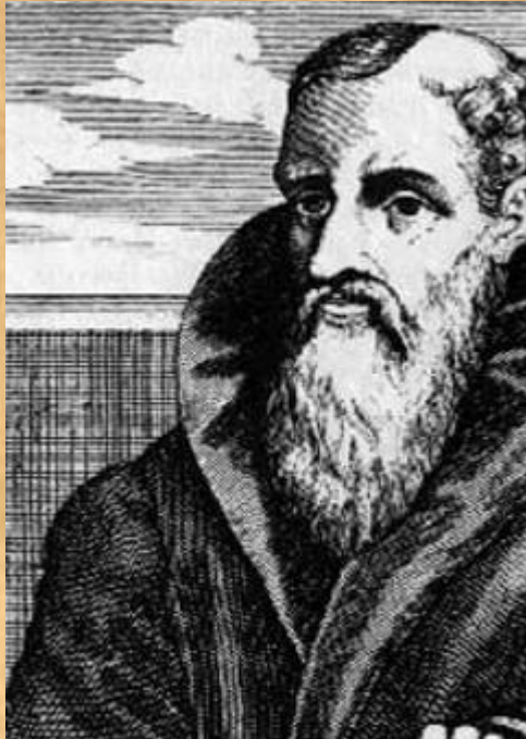
Аниций Манлий Торкват Северин Бозций (480-524).

Обучение в церковных школах повышенного уровня преподавалось по программе семи свободных искусств. Одним из первых формулу такой программы для средневековой Европы предложил Северин Бозций.