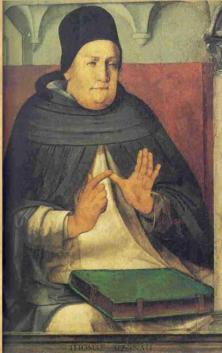
Фома Аквинский. (1225-1274 гг.)

Важную роль в становлении схоластики сыграл философ и теолог Фома Аквинский. Он пытался соединить светское знание и христианскую веру, поставив во главу постулаты религии.