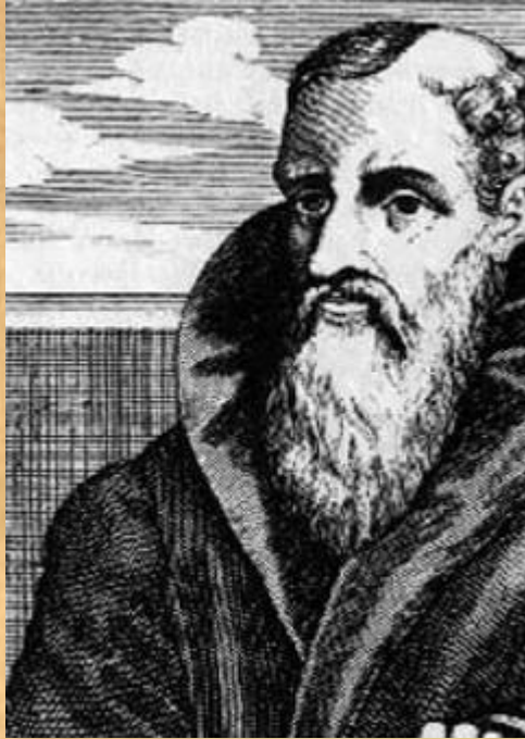
Аниций Манлий Торкват Северин Бозций (480-524).

Обучение в церковных школах повышенного уровня преподавалось по программе семи свободных искусств. Одним из первых формулу такой программы для средневековой Европы предложил Северин Бозций.