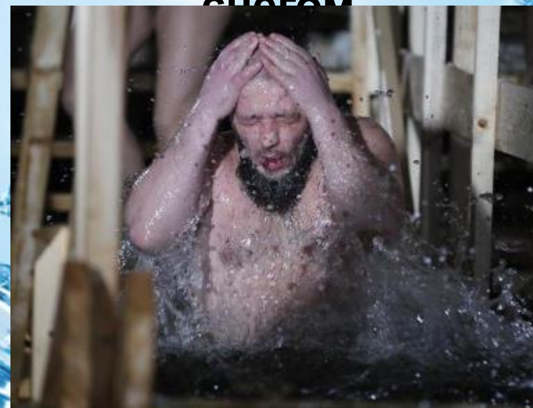
Купание в проруби