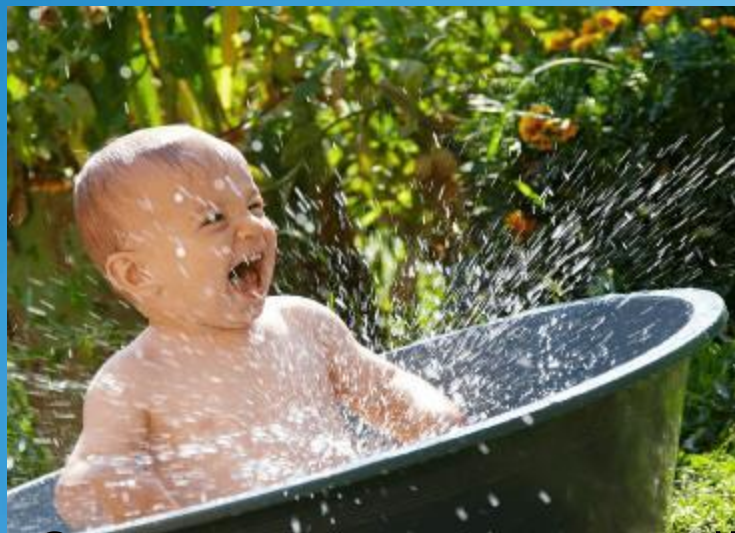
Закаливание холодной водой