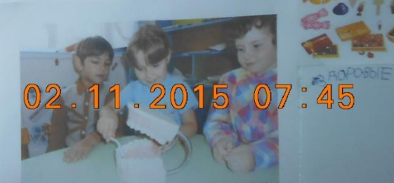
Фото-отчет для родителей