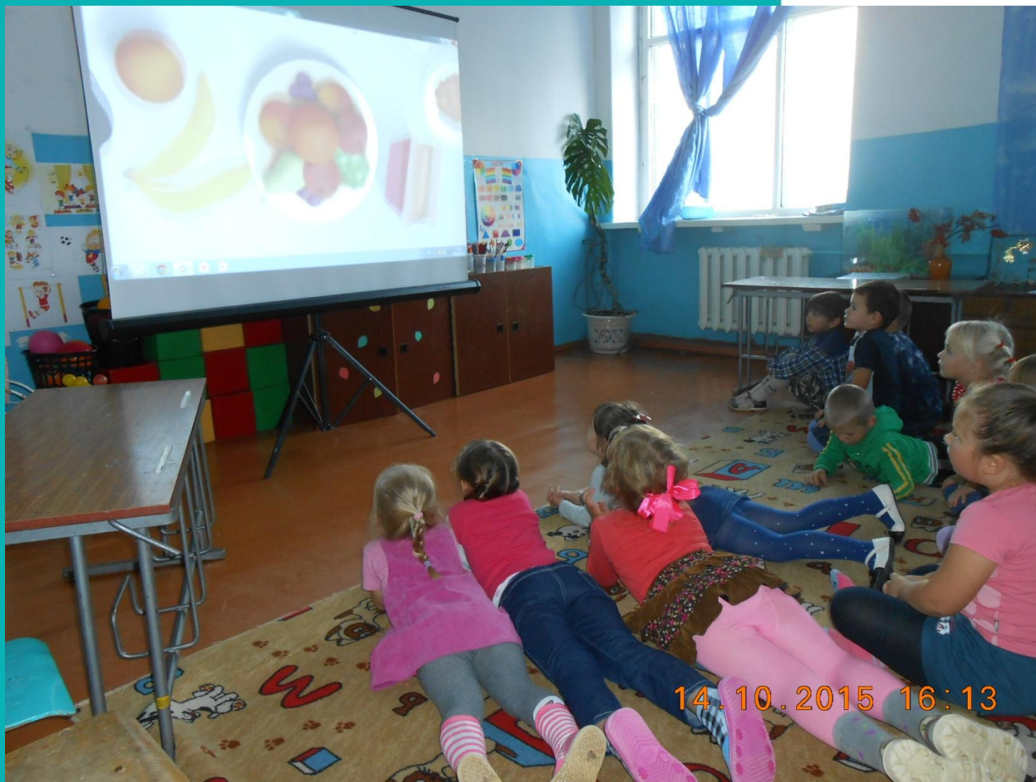
Просмотр презентации «Что полезно для здоровья»