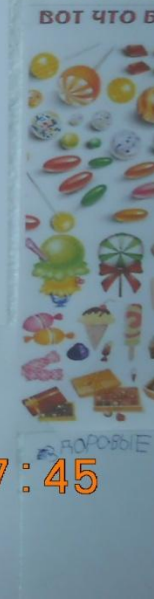
Фото-отчет для родителей