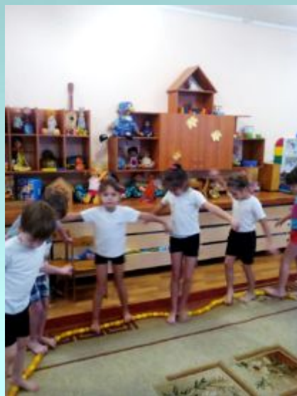
Корректирующие упражнения для профилактики плоскостопия и формирования правильной осанки