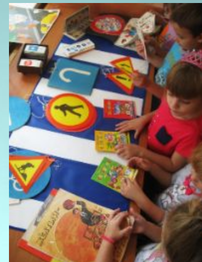
Профилактика детского дорожно- транспортного травматизма