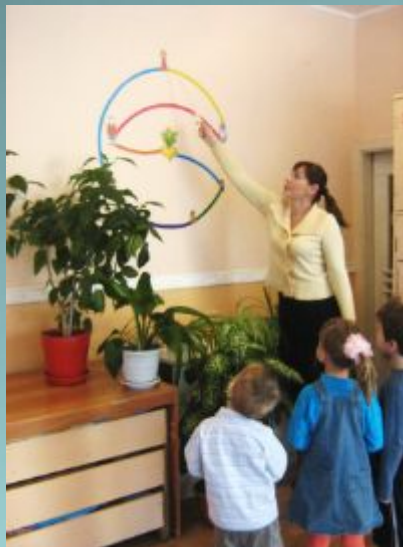
Офтальмологические тренажеры для сохранения зрения