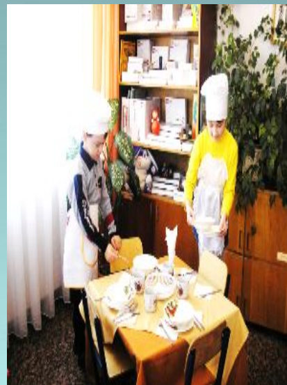
Формирование навыков культуры питания