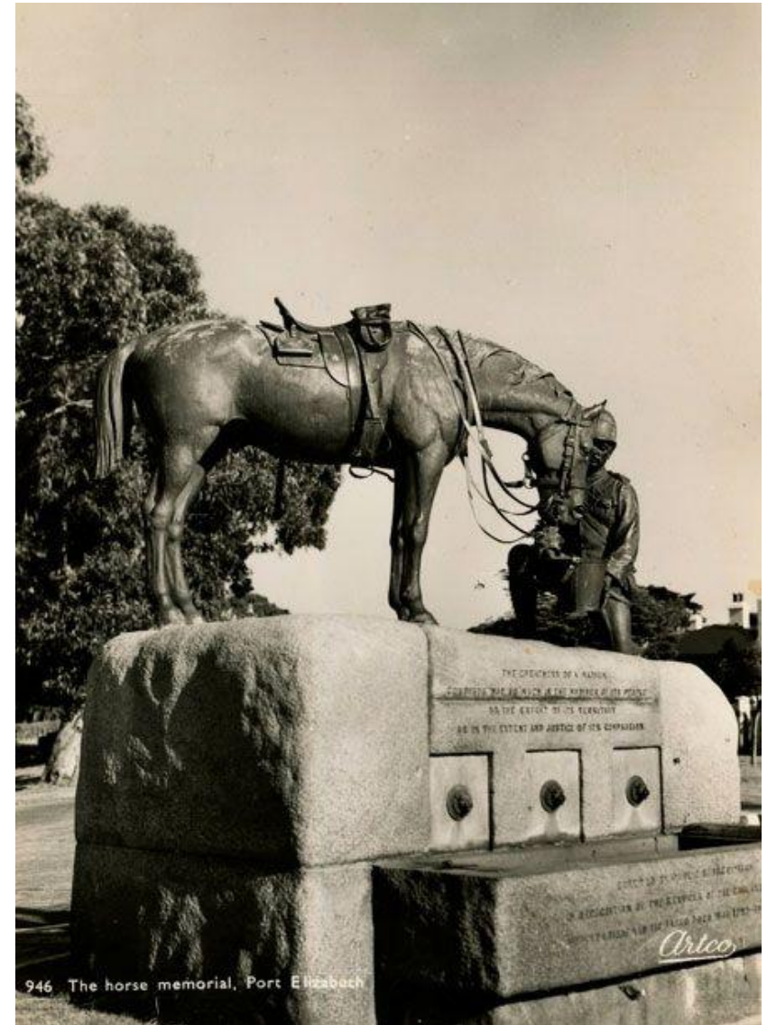
946 The horse memorial, Port Elizabeth