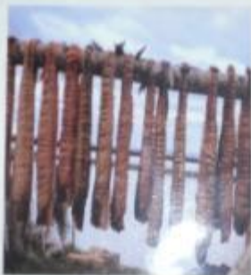
Юкола – вяленая рыба