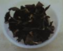
35AL3 – сушеное мясо