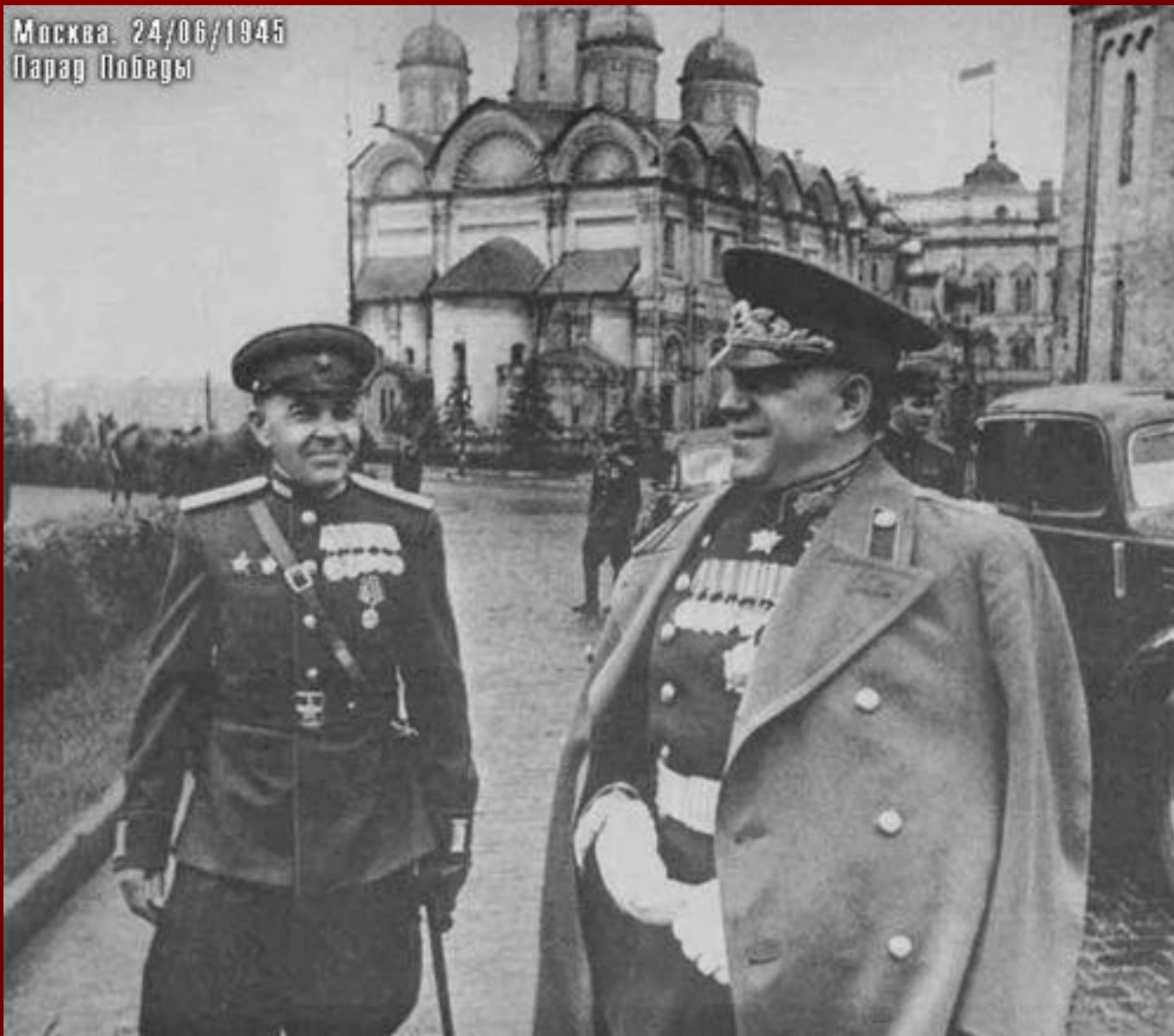
Жуков в кремле 24 июня 1945 г.