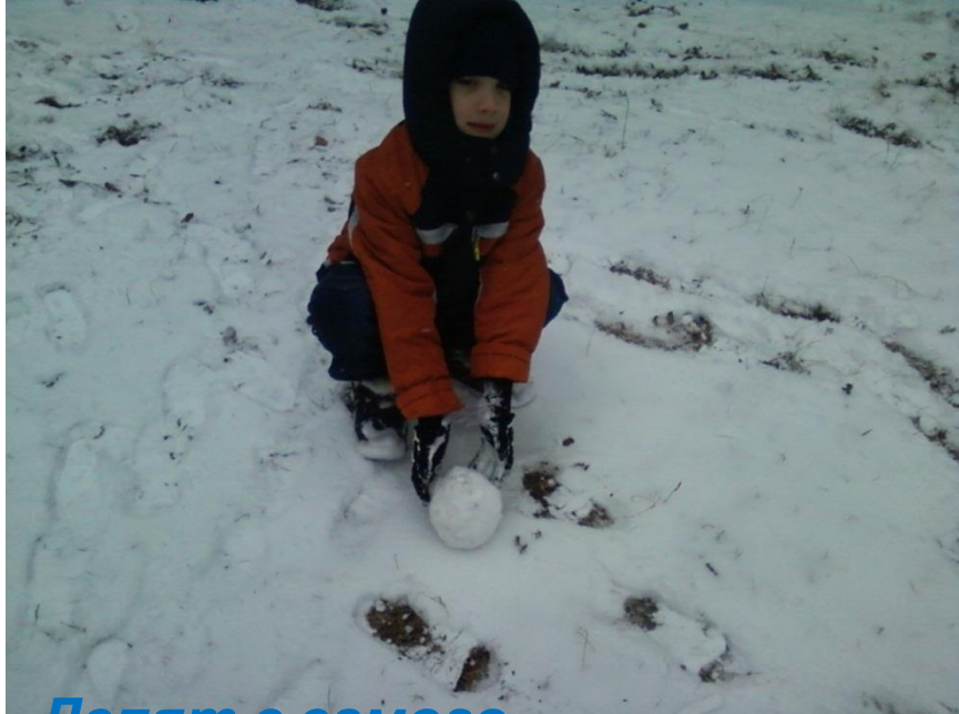
Лепят с самого утра