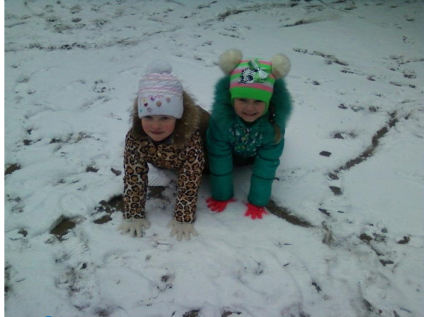
Снежные шары катают И смеясь соединяют.