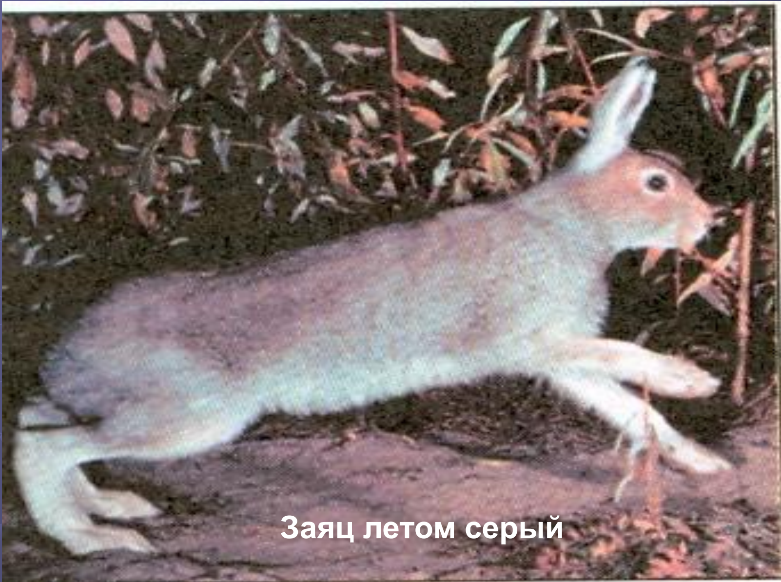
Заяц летом серый