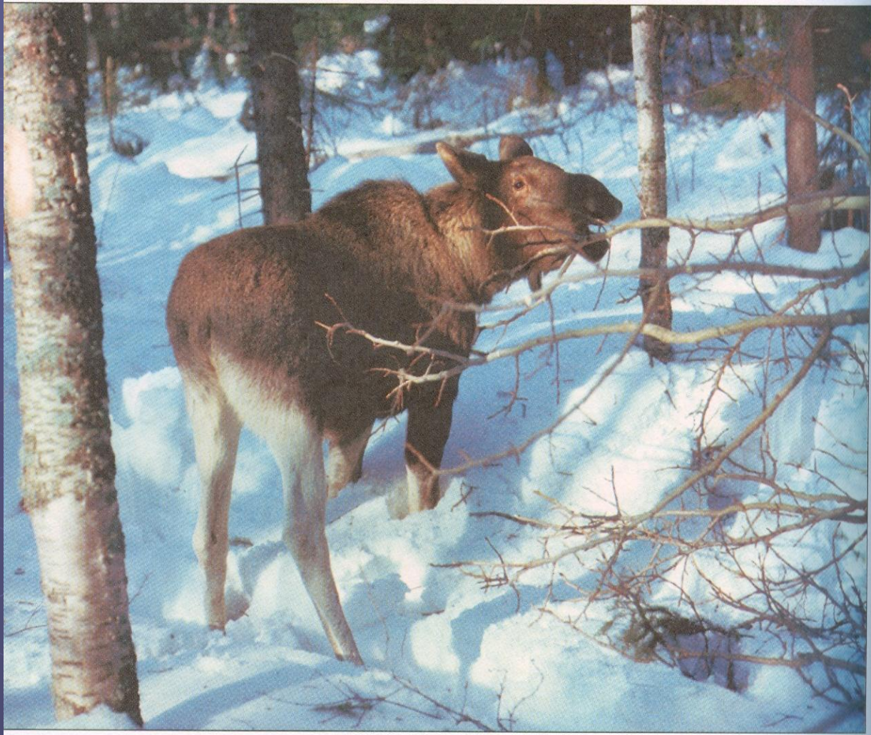
Лоси обгладывают осинки