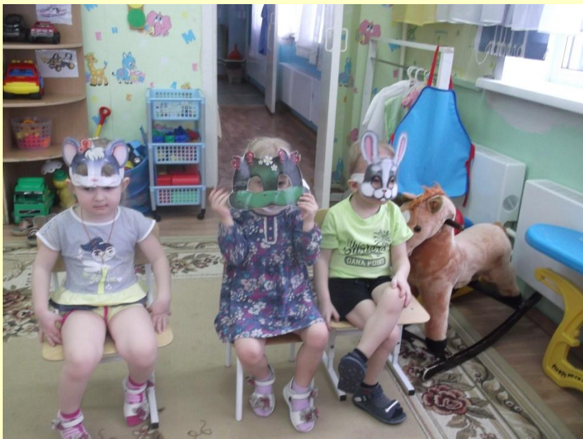
Уже трое в теремке