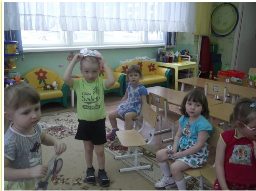
зайка и зрители