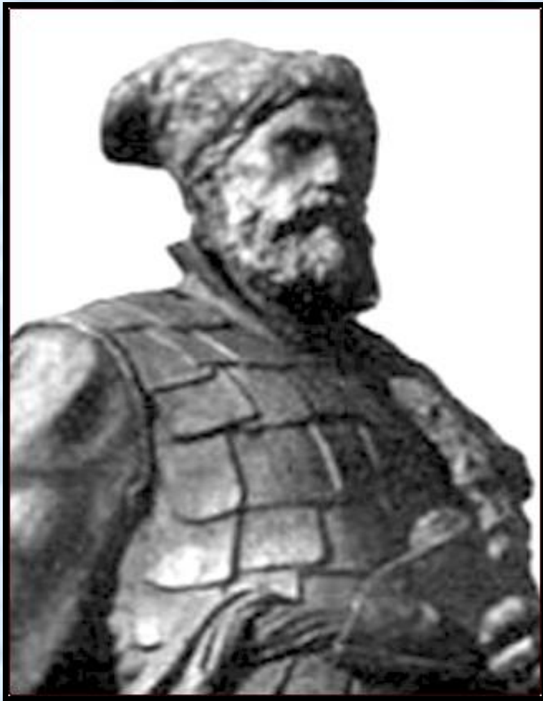
Ерофей Павлович Хабаров