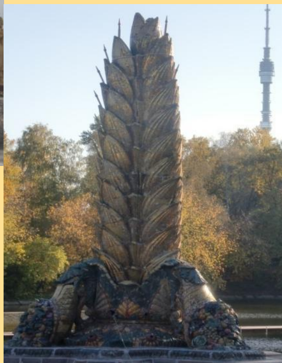
Фонтан «Золотой колос»