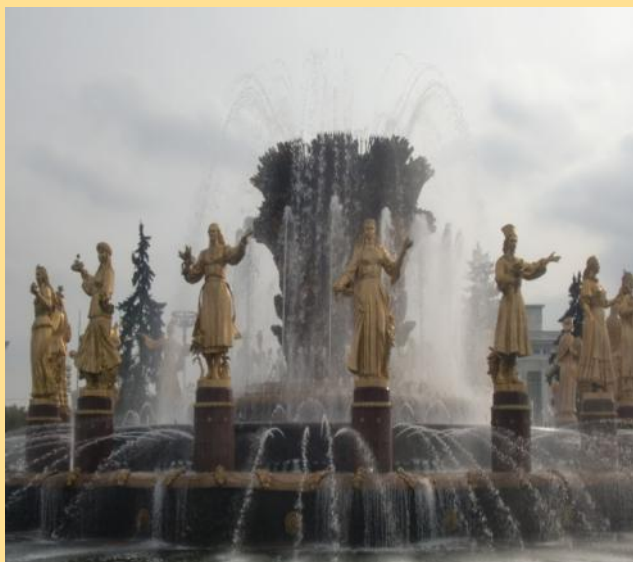
Фонтан «Золотой колос»