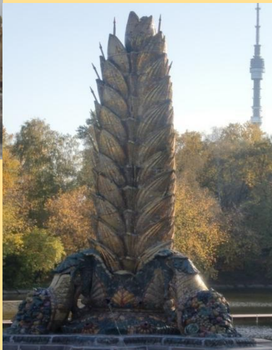
Фонтан «Золотой колос»