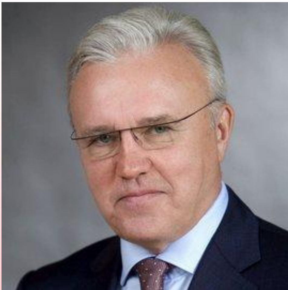
Александр Викторович Усс – губернатор Красноярского края