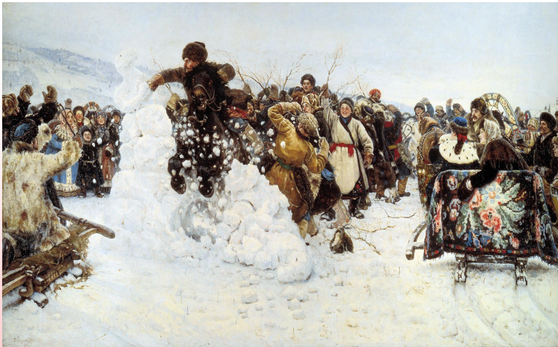
Картина «Взятие снежного городка» В.И. Суриков