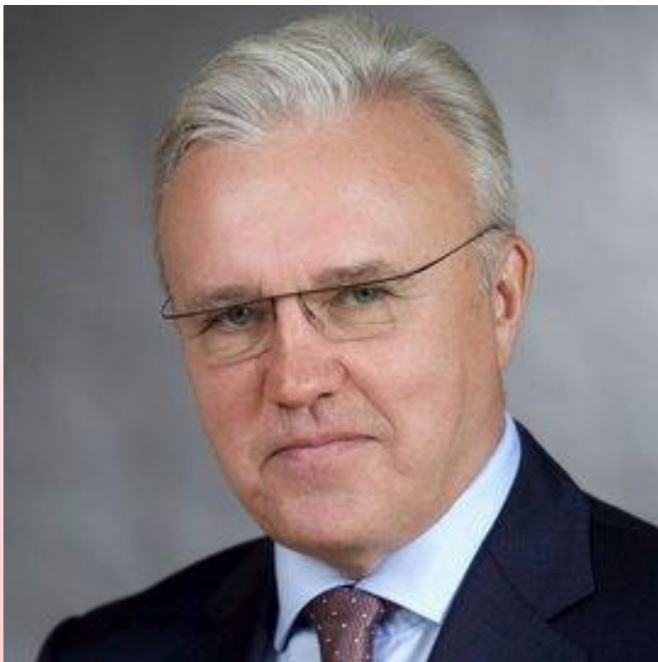
Александр Викторович Усс – губернатор Красноярского края