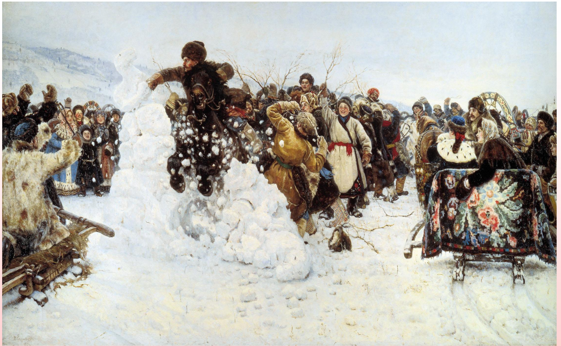
Картина «Взятие снежного городка» В.И. Суриков