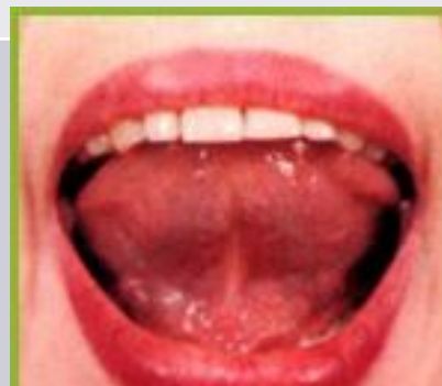
8. Вкусное варенье