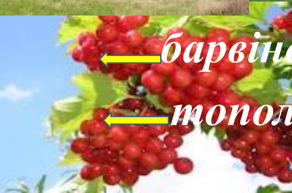
← калина →