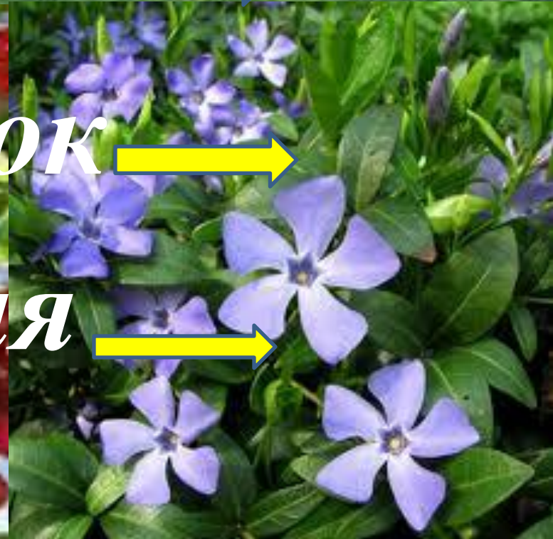
← барвінок →