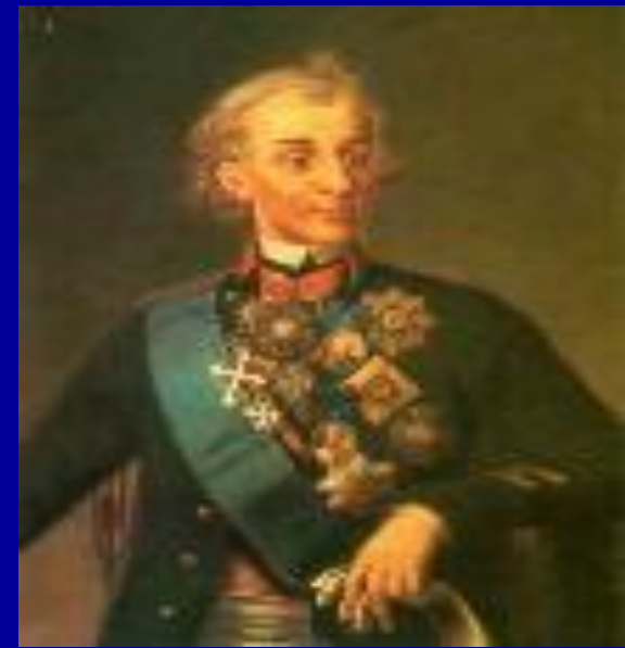
3. Александр Суворов.