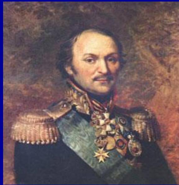
2. Матвей Платов.