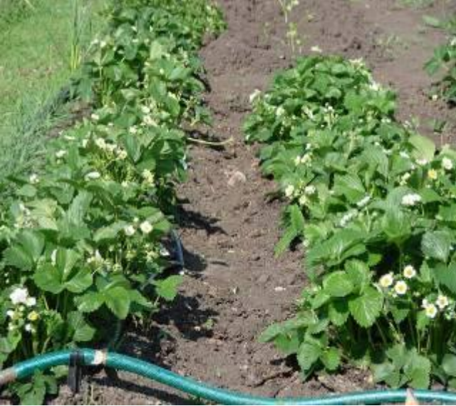
1. Кусты клубники.