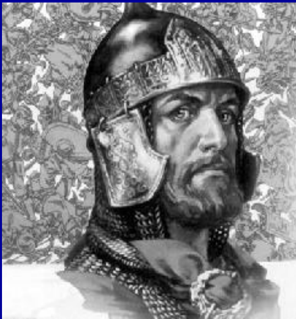
4. Александр Невский.