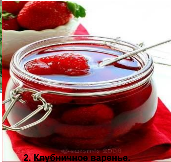
2. Клубничное варенье.