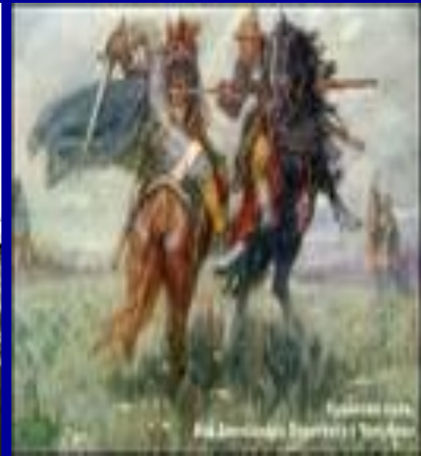
6. Дмитрий Донской.