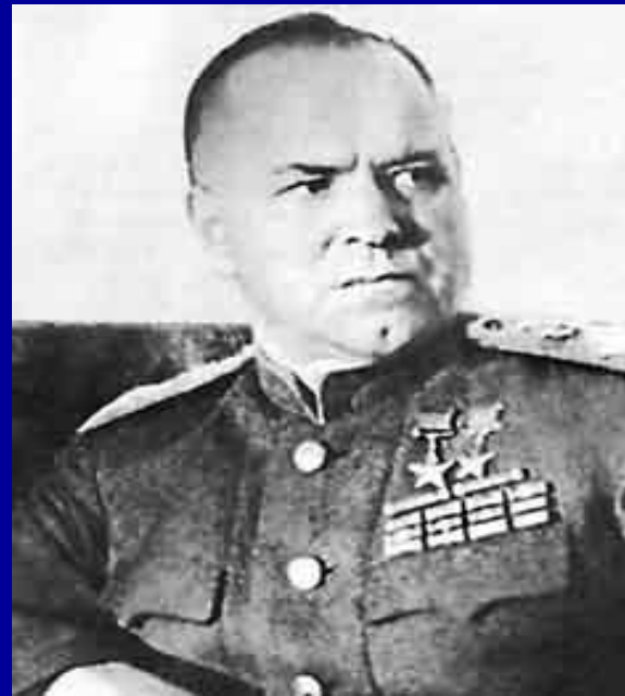
5. Георгий Жуков.