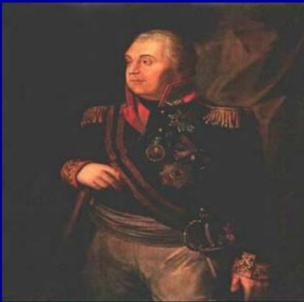
1. Михаил Кутузов.