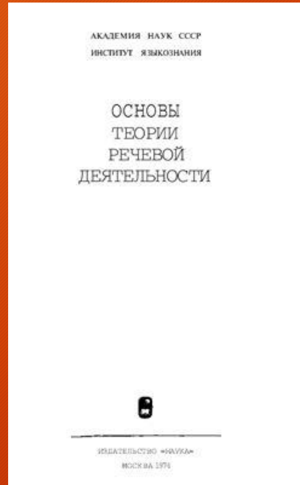
«Основы теории речевой деятельности» М.: Наука, 1974. — 368 с.