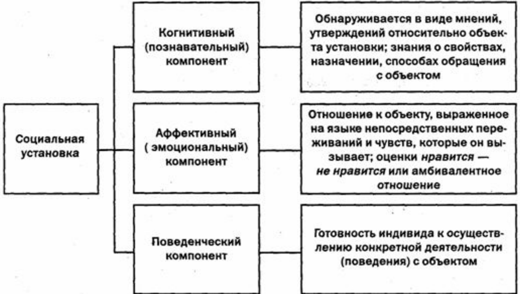
Рис. 19-1. Структура социальной установки по М. Смит