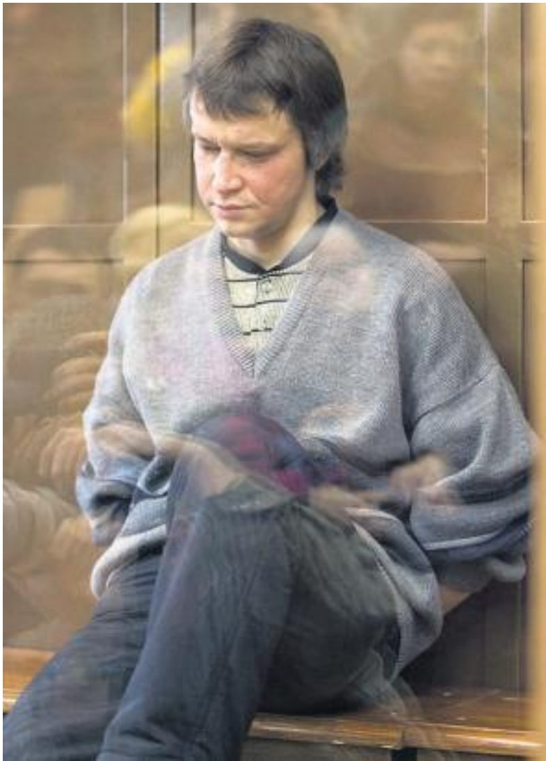
Маньяк Александр Пичушкин