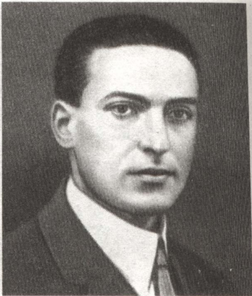
Л. С. Выготский