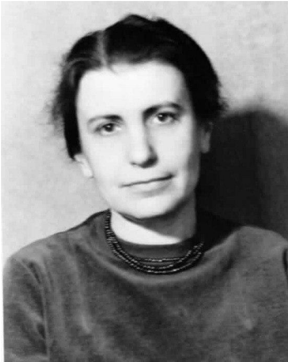
Школа основана Анной Фрейд (1895 - 1982)