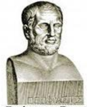
Теофраст из Ереса

Впервые термин «характер» предложил Теофраст, ученик Аристотеля, для обозначения комплекса признаков, отличающих одного человека от другого.