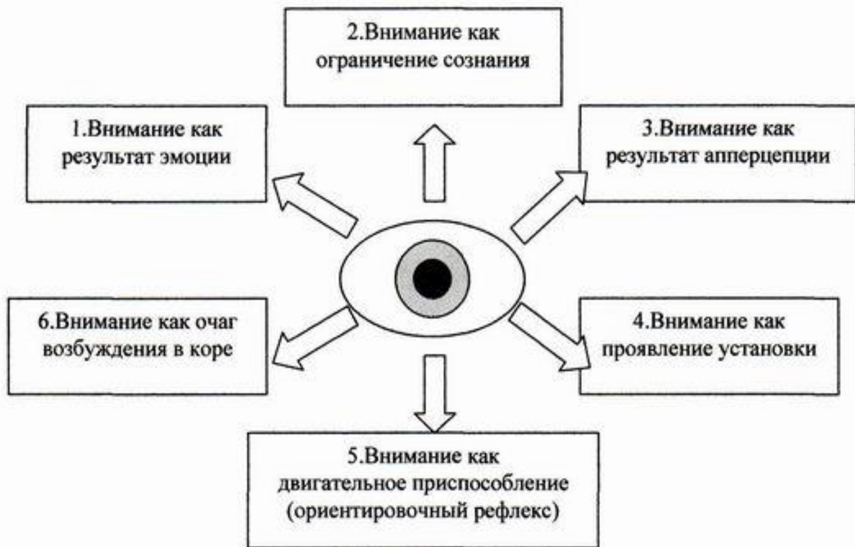
Рис. 12.2 Гипотезы внимания