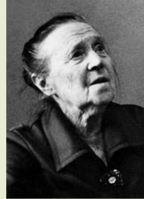
Зейгарник Б. В.