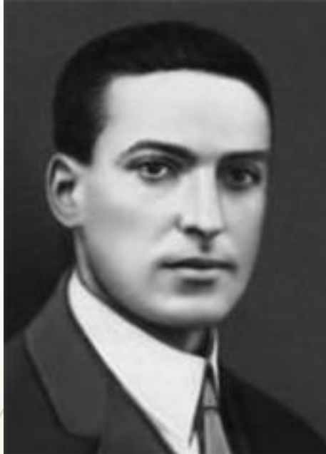
Выготский Л. С.