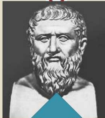
Платон древнегреческий философ (428-348 до н.э)