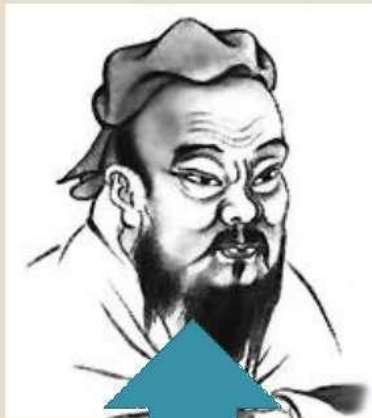
Конфуций древнекитайский мыслитель (551-479 до н.э)

Издавна проблематика конфликта была предметом изучения философов.