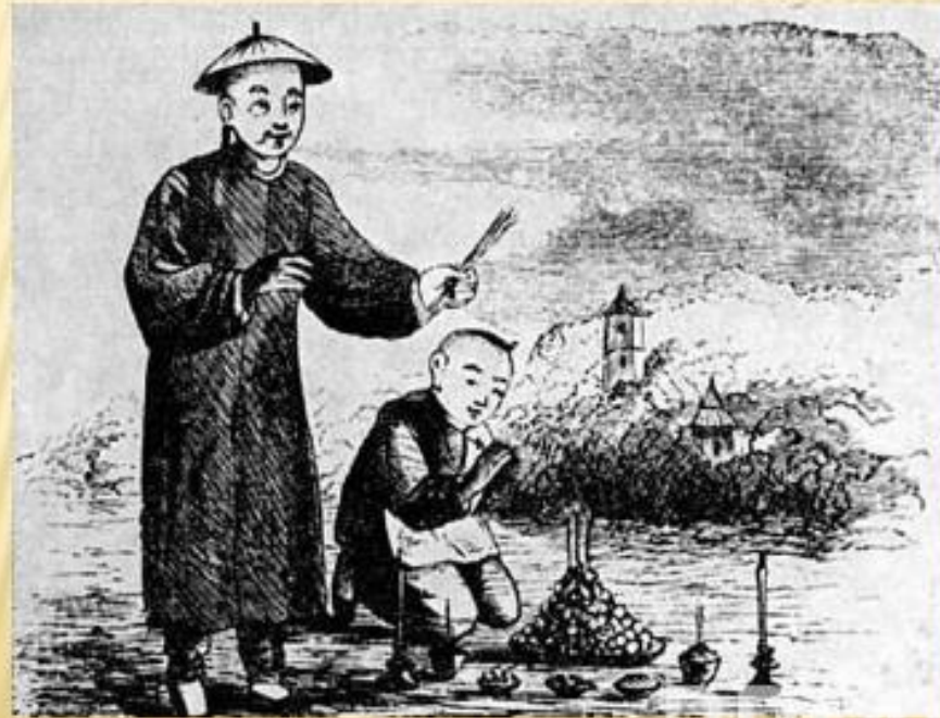
Молодой Конфуций приносит жертву

Исходным пунктом учения Конфуция является достижение гармонии между нравственным совершенствованием человека и его деятельностью. Такая гармония, по его мнению, - залог построения идеального общества и государства. Социальным идеалом послужил золотой век в истории Китая, правление мифических императоров Яо, Шунь и Юй. За прошедшее время общество Китая деградировало, что выразилось в многочисленных конфликтах. Исходя из этого конфуцианство предлагает принцип «выпрямления имен» (возвращение прежнего смысла словам и понятиям), который будет предпосылкой восстановления прежних норм.