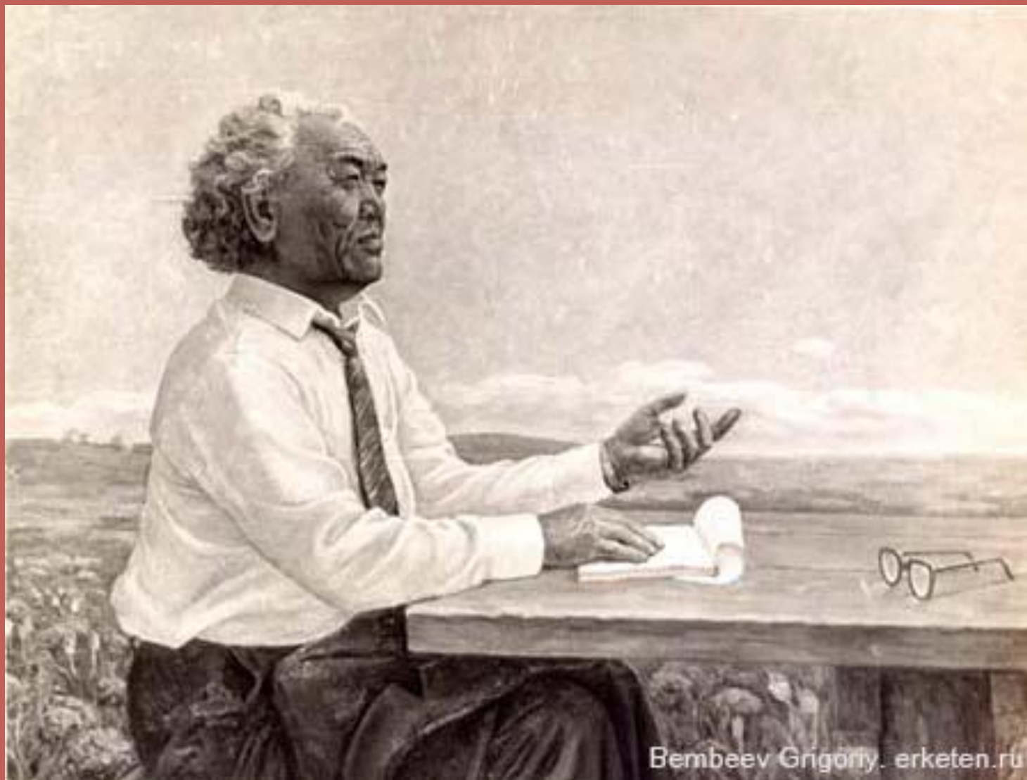
Калмыцкий поэт и писатель Давид Никитич Кугультинов