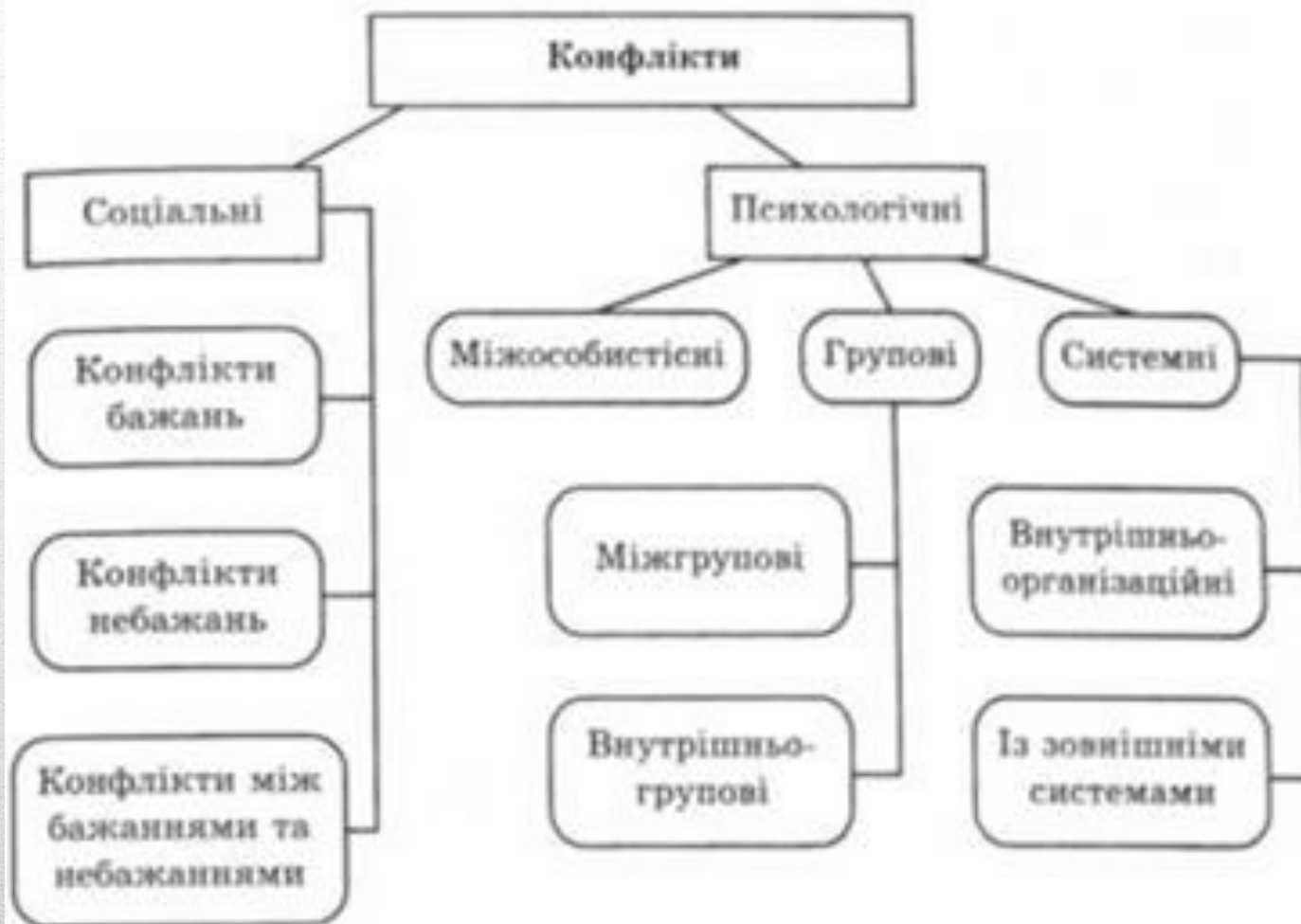
Рис. 8.1. Класифікація конфліктів