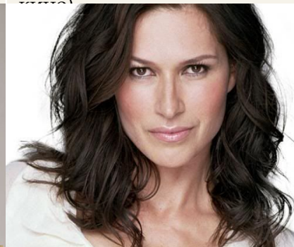
Ломбард Карина (американская актриса кино)