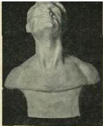
Табл. 33. Резко запрокинутая голова