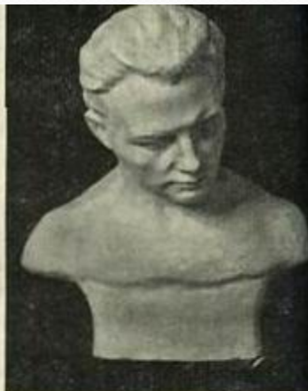
Табл. 34. Наклон головы вправо