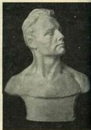
Табл. 36. Приподнятая голова