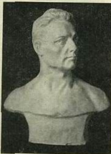
Табл. 35. Поворот головы вправо