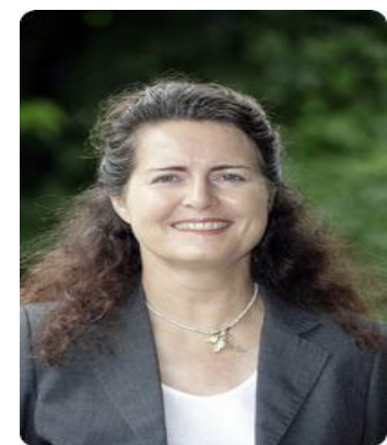
Автор: Эрика Регнет

Автор детально прорабатывает такие темы: типы конфликтов и причины их возникновения, последствия конфликтов и оптимальные способы их урегулирования, способы поведения в конфликте, возможные решения для руководителей в ситуации конфликта