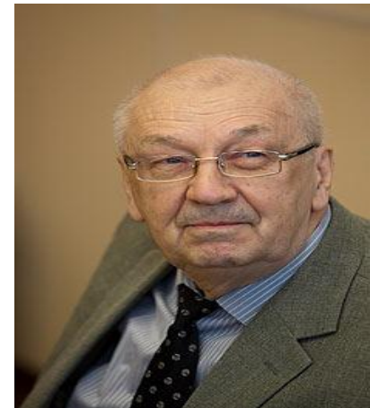
Автор: А.В. Дмитриев

Использованы разработки западных специалистов, а также последние разработки российских исследователей. Особое внимание уделяется технологии смягчения и регулирования конфликтов.