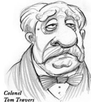
Colonel Tom Travers