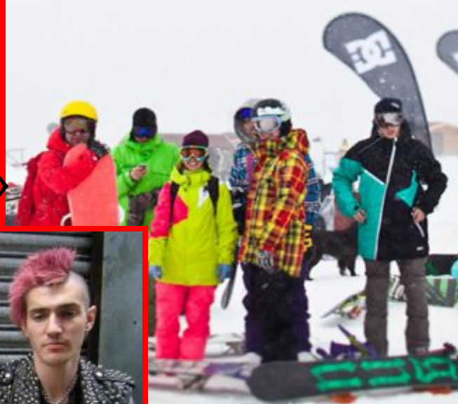
Группа любителей спорта