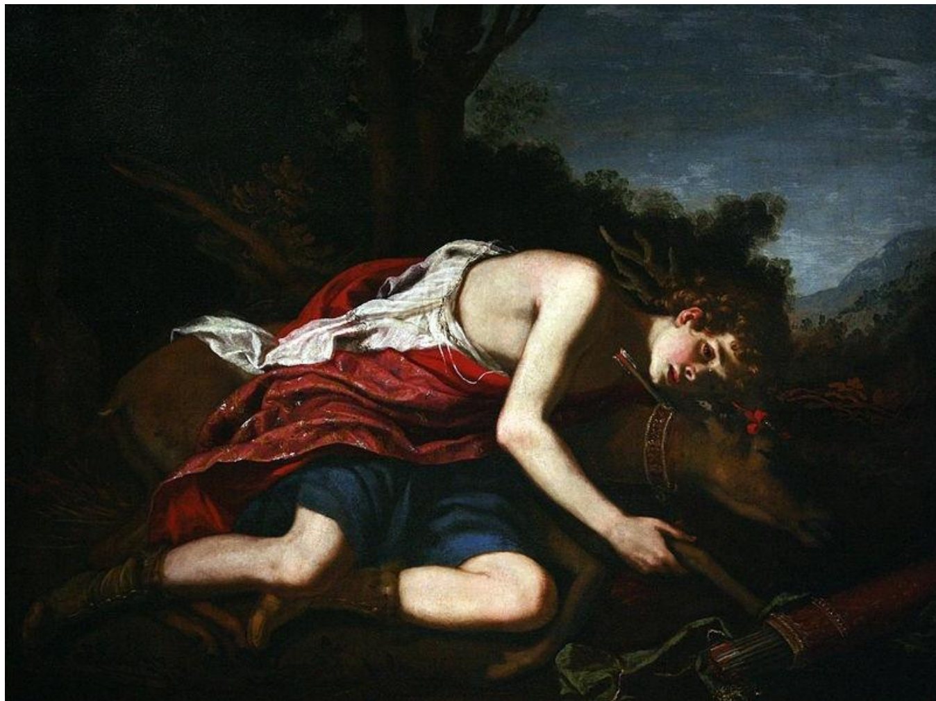
Худ. Якопо Віньялі. Депресія мисливця Кипариса, який ненавмисне вбив свого улюбленця-оленя.