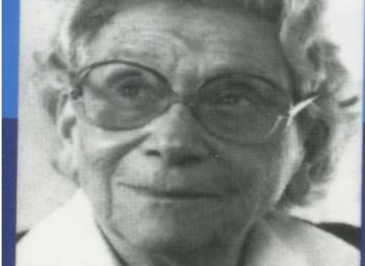
Эмми Пиклер - 1902-1984

Эмми Пиклер - выдающийся венгерский врач-педиатр и педагог. В Доме ребенка Лоци в Будапеште ей удалось создать условия для здорового развития детей-сирот. У детей Лоци не было задержек психического развития, что до этого времени считалось невозможным. Работа Пиклер в Лоци признана ВОЗ. Э.Пиклер – классик современной ясельной педагогики.