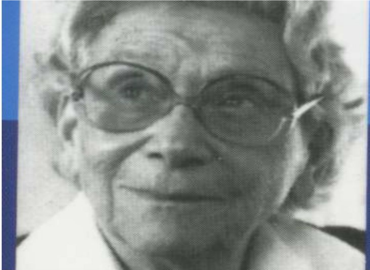
Эмми Пиклер - 1902-1984

Эмми Пиклер - выдающийся венгерский врач-педиатр и педагог. В Доме ребенка Лоци в Будапеште ей удалось создать условия для здорового развития детей-сирот. У детей Лоци не было задержек психического развития, что до этого времени считалось невозможным. Работа Пиклер в Лоци признана ВОЗ. Э.Пиклер – классик современной ясельной педагогики.