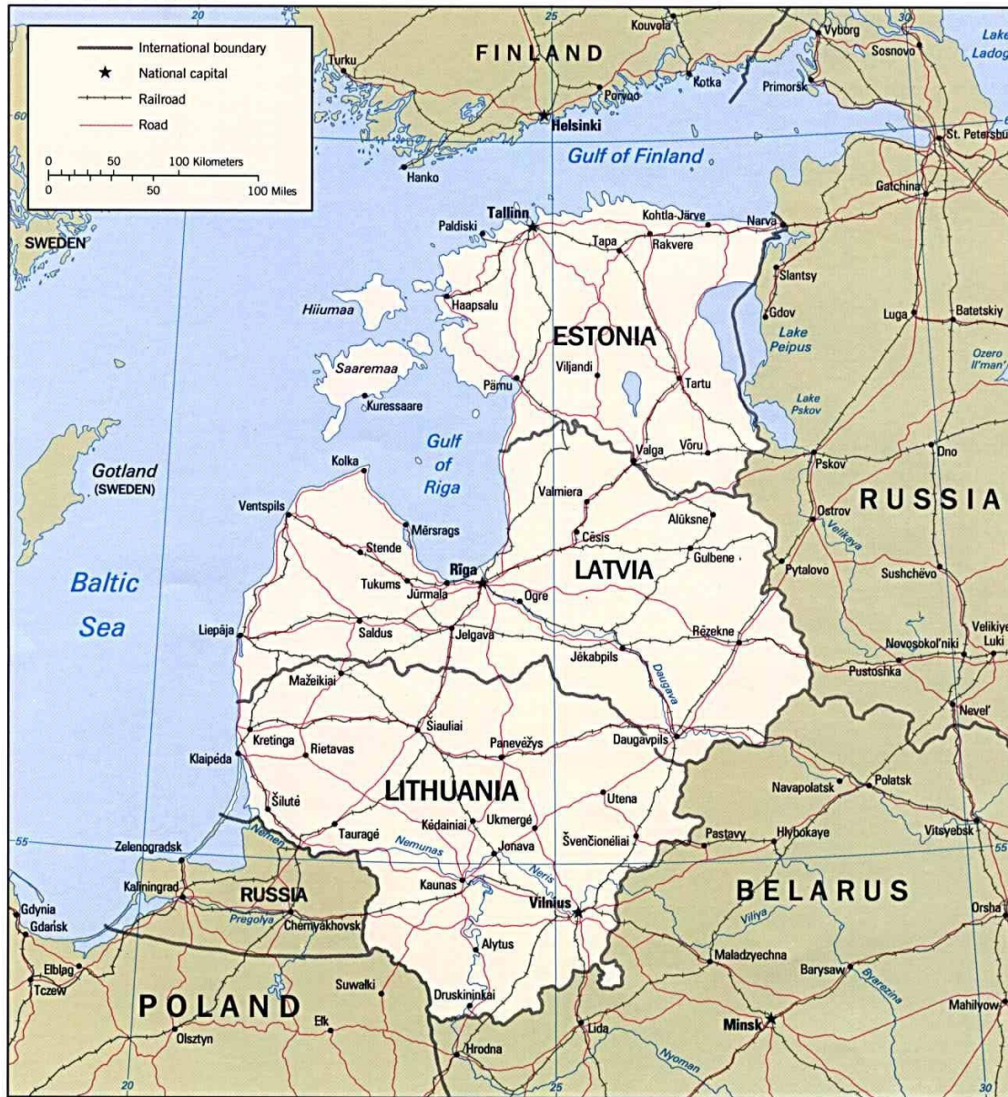
The Baltic States