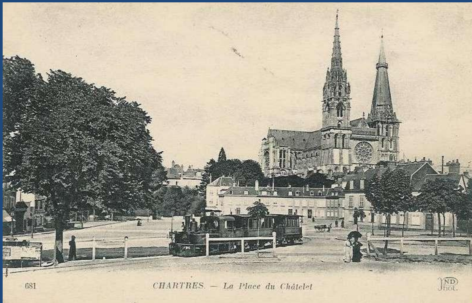
Фотография 1910 года