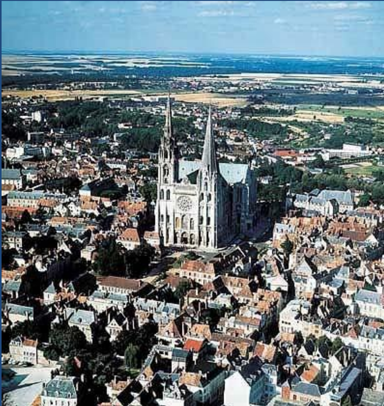
ШАРТРСКИЙ СОБОР, собор Нотр-Дам в Шартре во Франции (800 лет)