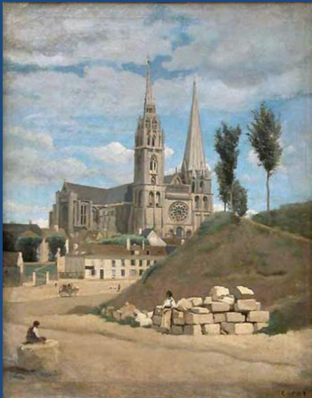
Картина 1830 года