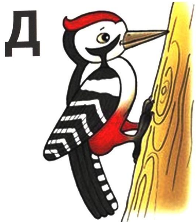
"Д-д-д" - дятел стучит по дереву

По этой же схеме мы обучаем родному языку детей с проблемами речи.