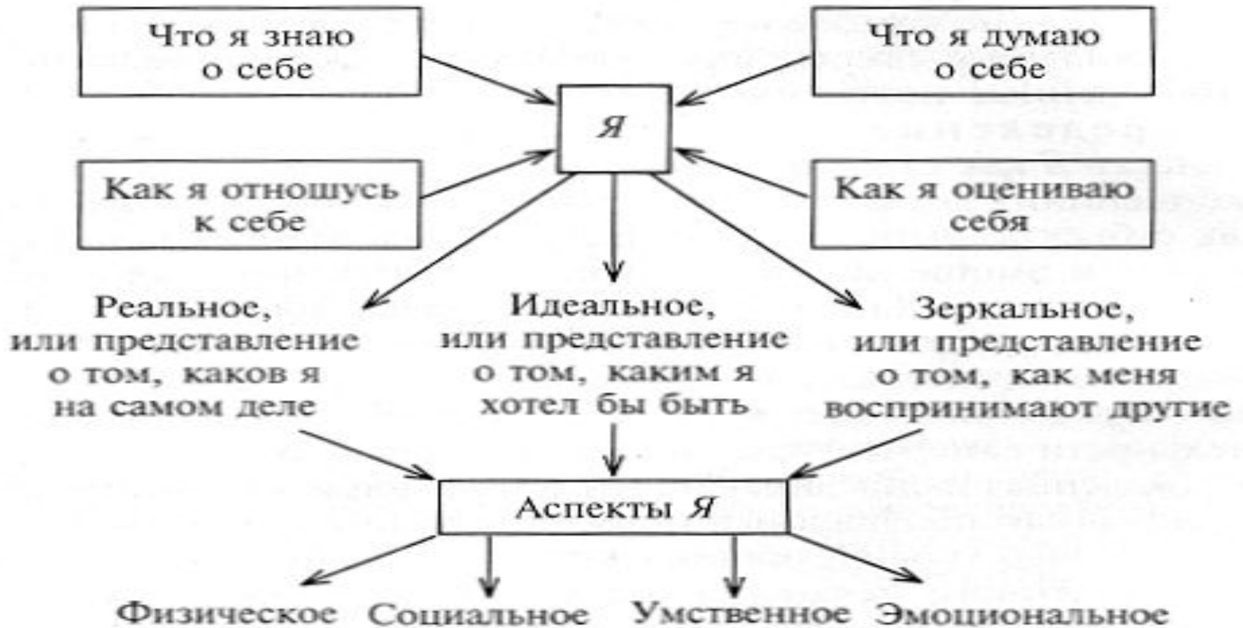
Рис. 3. Структура Я-концепции