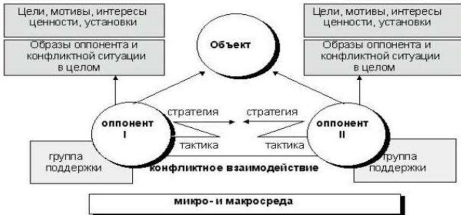
Структура конфликтной ситуации