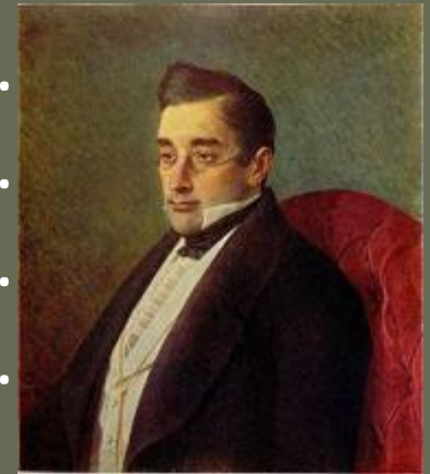
Александр Сергеевич ГРИБОЕДОВ